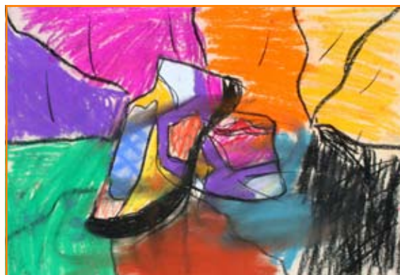
Valentina Trinkaus, 8. b