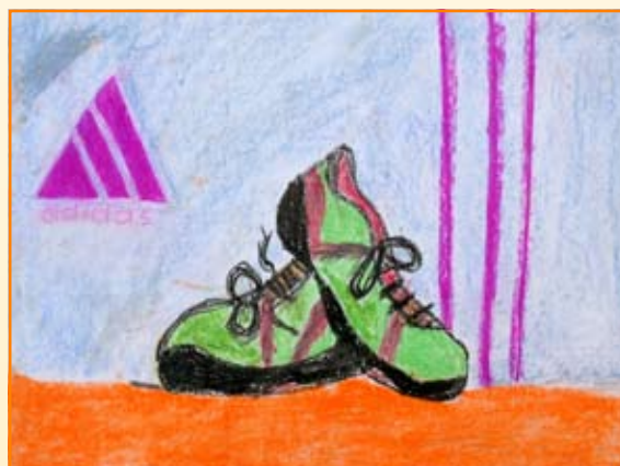
Špela Slanič, 8. b