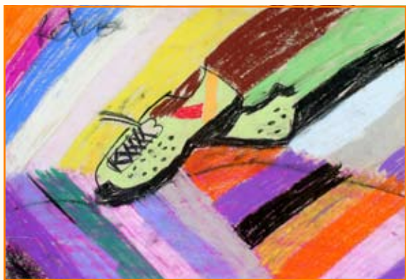
Petra Čeh, 8. b