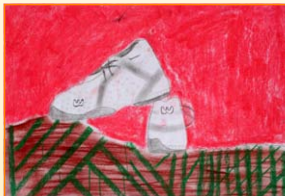
Ines Vrabl, 8. b