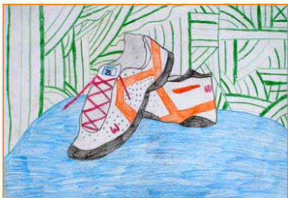
Iris Štraus, 8. a