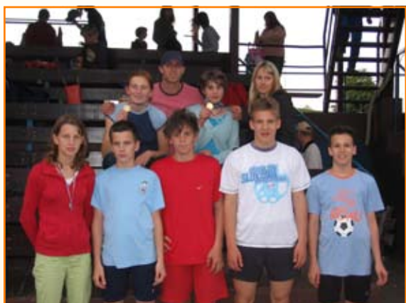
Udeleženci in dobitniki kolajn na območnem tekmovanju.