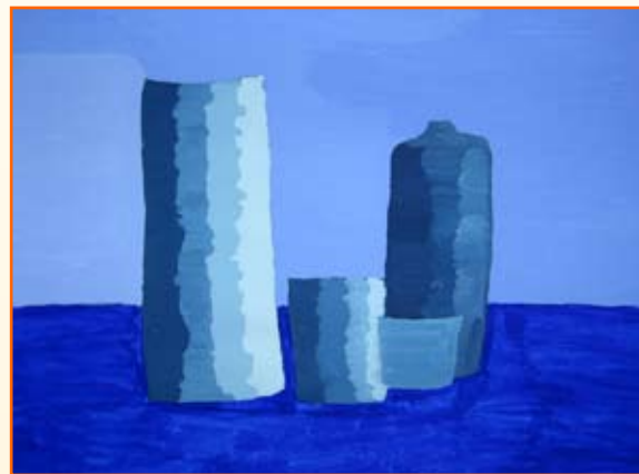
Monia Kolarič, 9. b