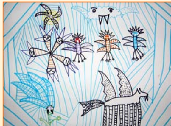
Ina Pivljakovič, 4. b