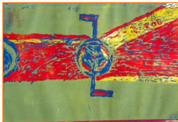
Špela Slanič, 7. r.