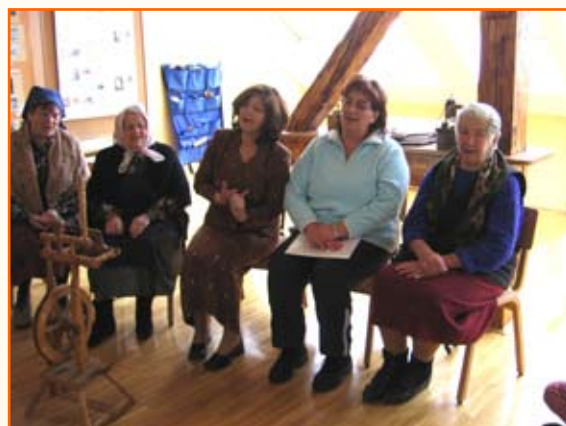
Ubrano ljudsko petje.

V začetku marca smo povabili v goste Inino babico, njeno sestro, prababico in njune prijateljice. Prijazne gospe so nam z glasbo in živo pripovedjo pričarale stare čase. Navdušeno smo jih sprejeli, saj redko slišimo tako ubrano ljudsko petje. Zapele so nam pesmi o kolinah, o pomladi in nam pripovedovale, kako so nekoč živeli. S seboj so prinesle celo kolovrat in pravo laneno odejo.