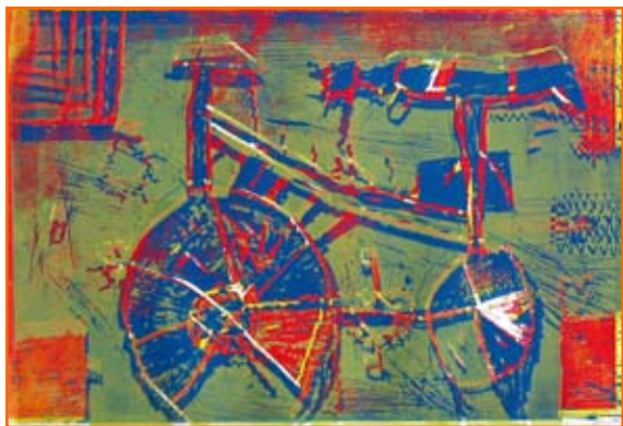
Valntina Trinkaus, 7. r.