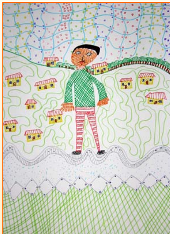
Rok Peklar, 4. a