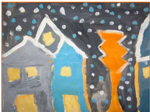
Ina Pivljakovič, 4. b