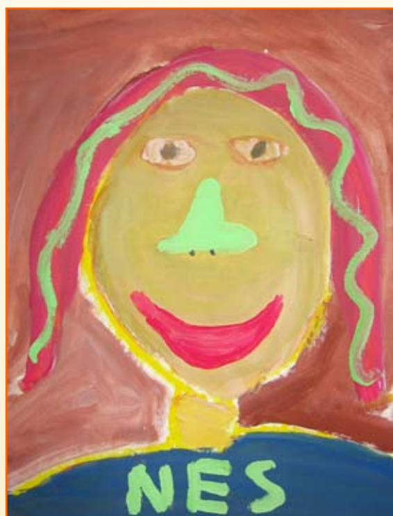
Žiga Živko, 4. b