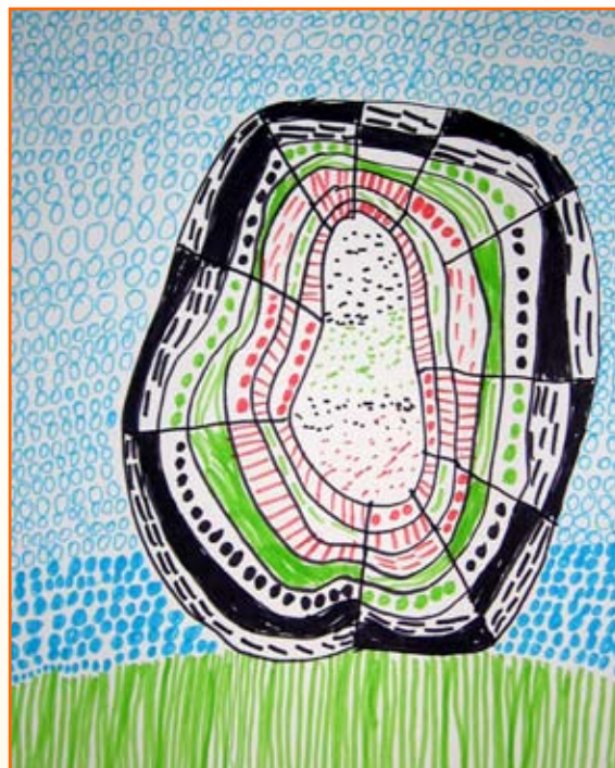
Aljaž Polič, 4. a