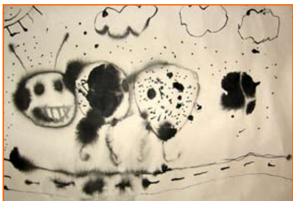
Sara Smodiš, 2. r.