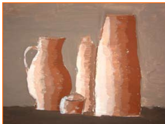
Natalija Ploj, 9. a