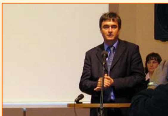
Minister za šolstvo in šport, g. Milan Zver.