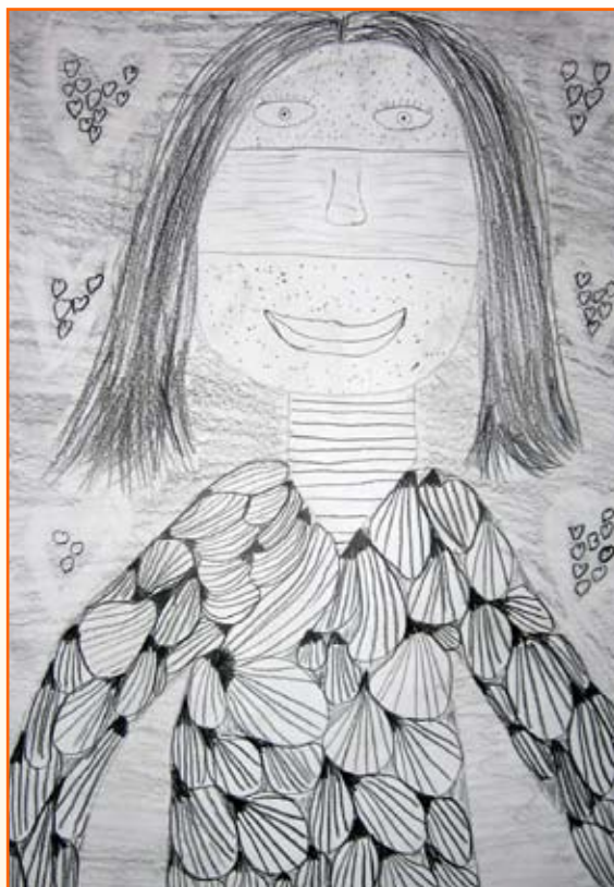
Tjaša Polanec, 4. b