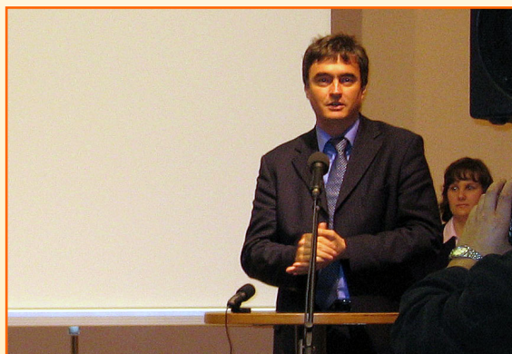
Minister za šolstvo in šport, g. Milan Zver.