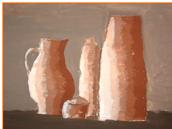
Natalija Ploj, 9. a