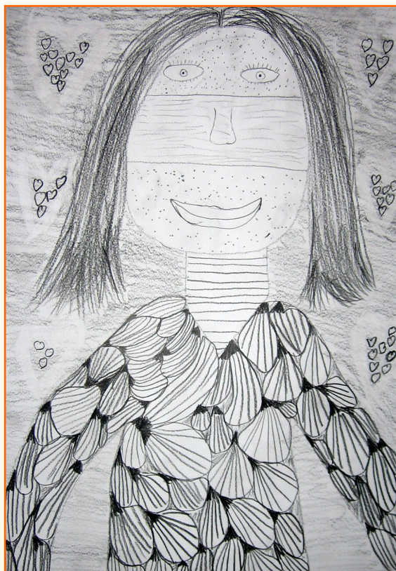
Tjaša Polanec, 4. b