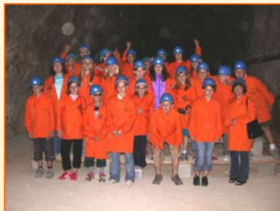
Zaključna ekskurzija 5. razreda v rudniku Mežica.