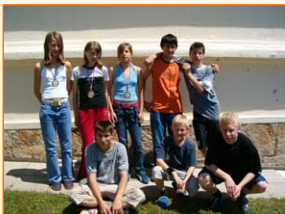
Udeleženci in dobitniki kolajn občinskega tekmovanja v krosu.