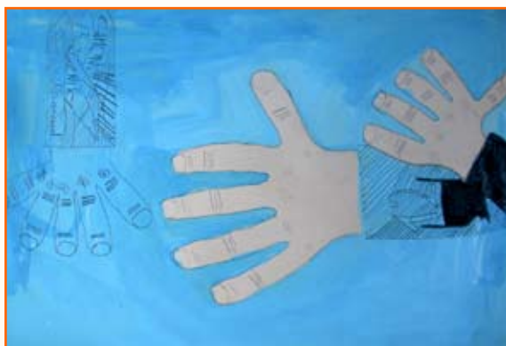
Simon Breznik, 5. r.