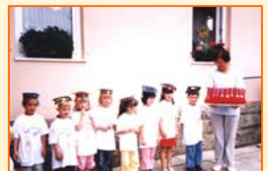
Skupina vrabčki iz Selc