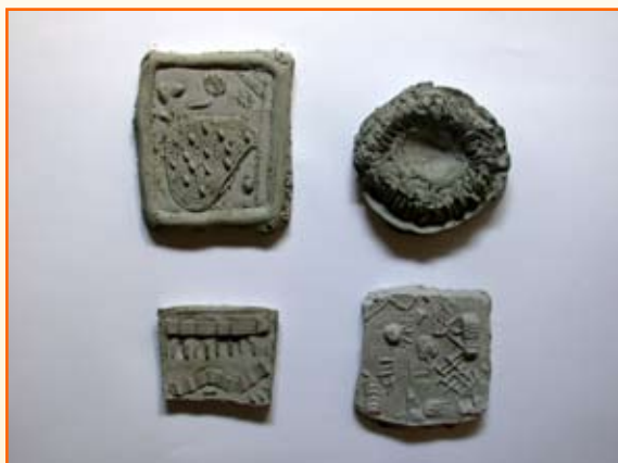
Učenci 7. r.