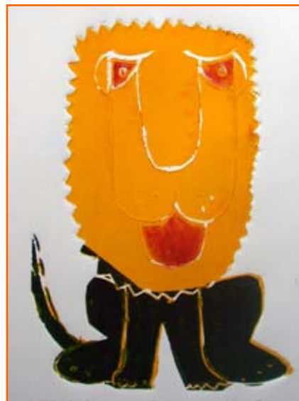
Katja Polanec, 8. b/9