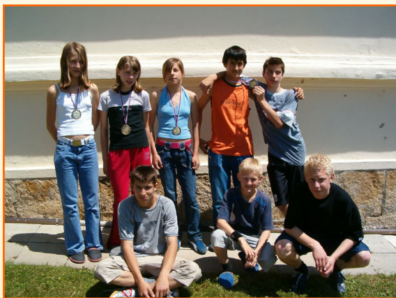
Udeleženci in dobitniki kolajn občinskega tekmovanja v krosu.