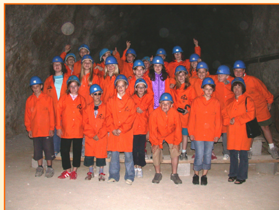
Zaključna ekskurzija 5. razreda v rudniku Mežica.