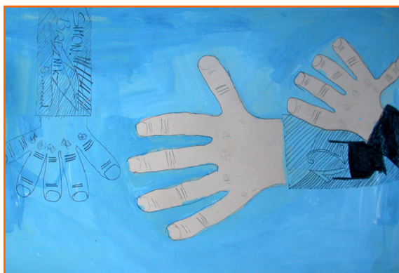
Simon Breznik, 5. r.