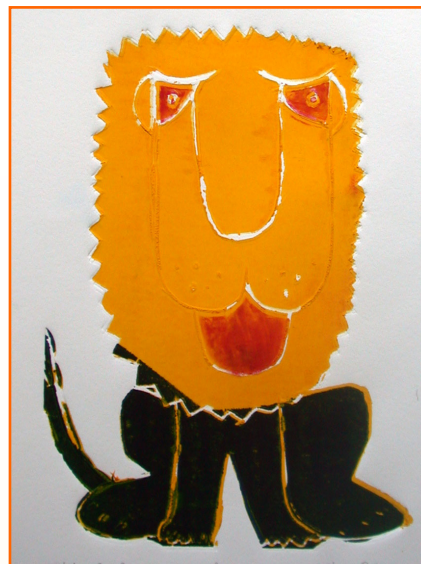
Katja Polanec, 8. b/9