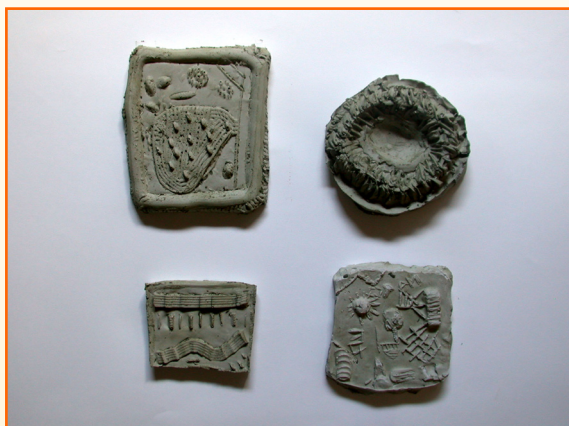
Učenci 7. r.