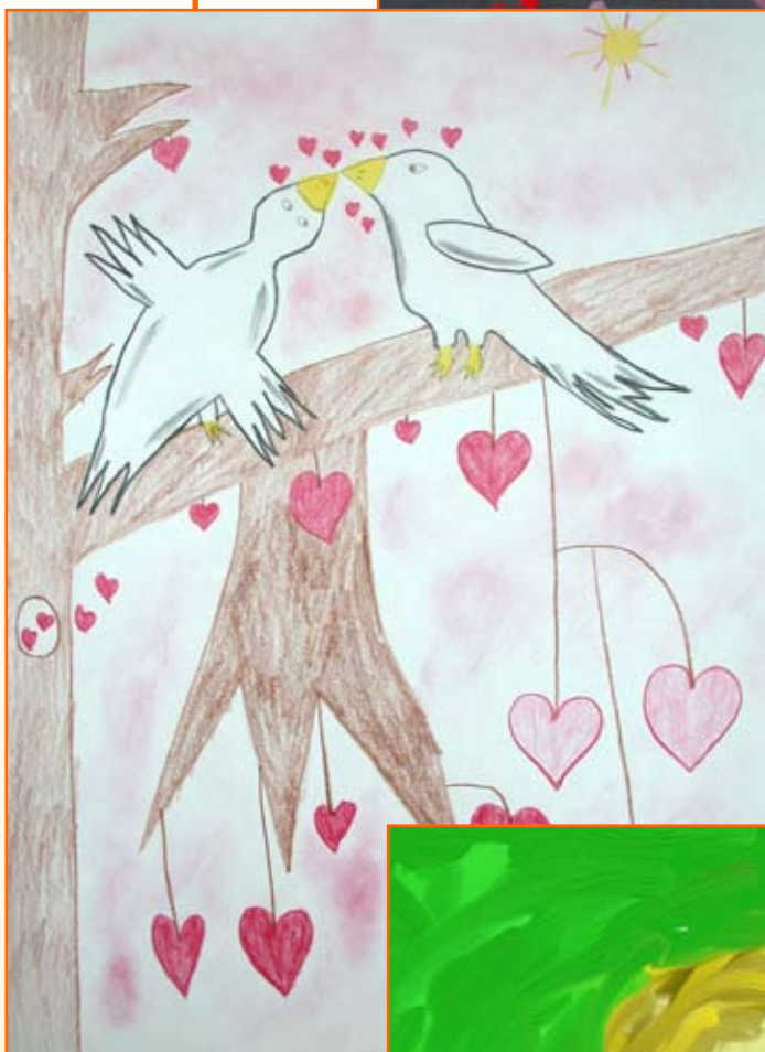
Anja Vrabl, 4. r.