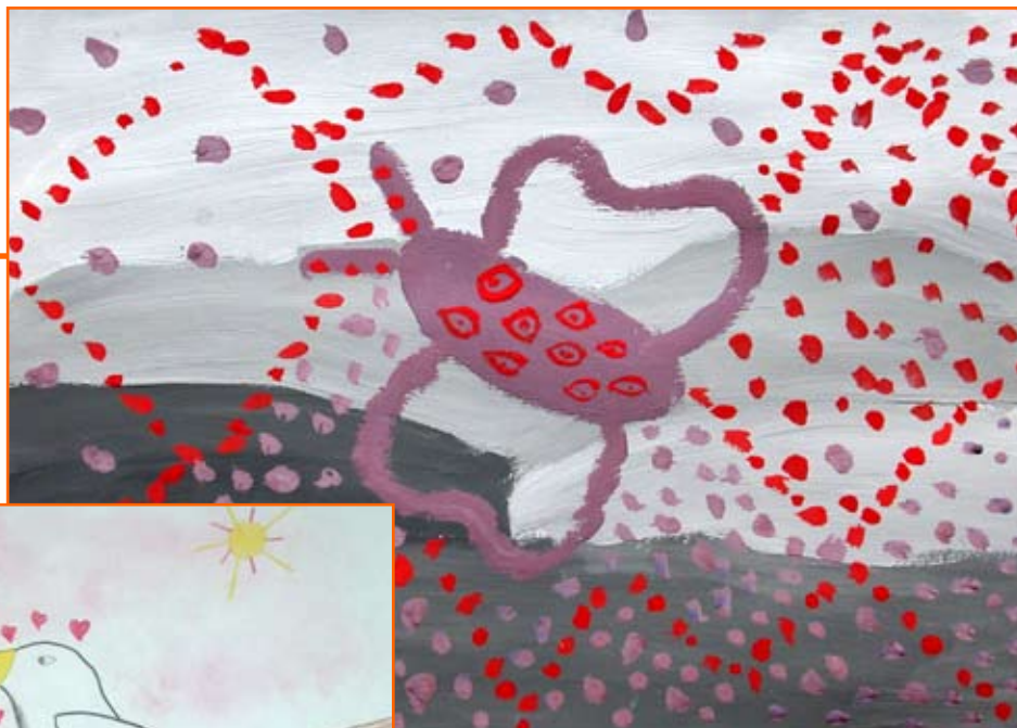
Petra Čeh, 5. r.