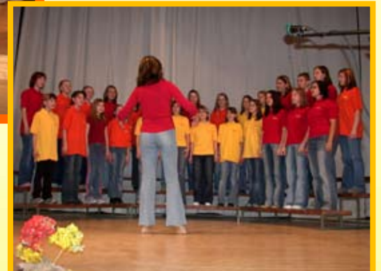
Utrinki iz proslave ob materinskem dnevu.

V četrtek, 24. marca 2005, smo v Kulturnem domu Voličina imeli proslavo ob materinskem dnevu. Učenci Osnovne šole Voličina so pod vodstvom svojih učiteljic pripravili pester program, namenjen svojim mamam, babicam, sestram, tetam ... Torej vsem tistim, ki so mame in jih imajo radi.