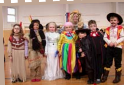
veliko različnih pustnih mask,