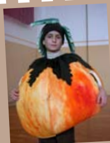
najboljše in jih nagradili.