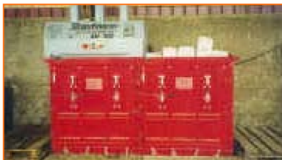
Papir, steklo in kovine