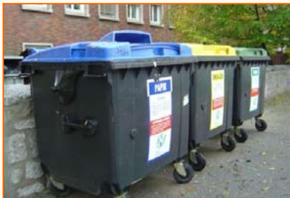
Zabojniki za ločeno zbiranje odpadkov