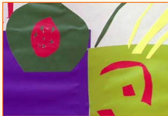
Grogor Brdnik, 5. r