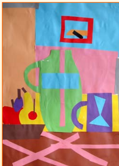
Simon Breznik, 5. r