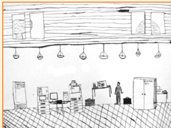
Tadej Horvat, 7. r/9