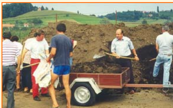
Biološki komunalni odpadki