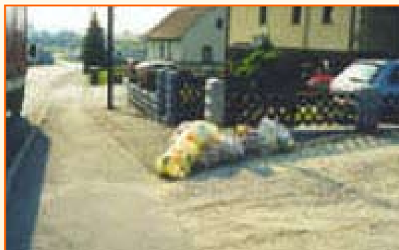
Zbiranje odpadne plastike

V Sloveniji letno ustvarimo preko 900.000 ton odpadkov, v povprečju preko 450 kg na prebivalca. Vsak od nas letno kupi okoli 100 kg embalaže.