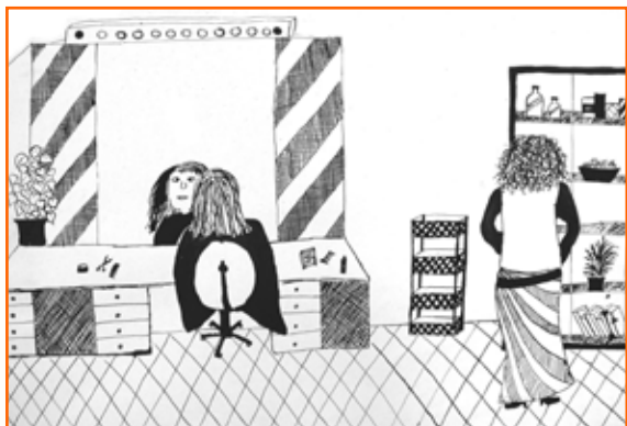
Tamara Fras, 8. b