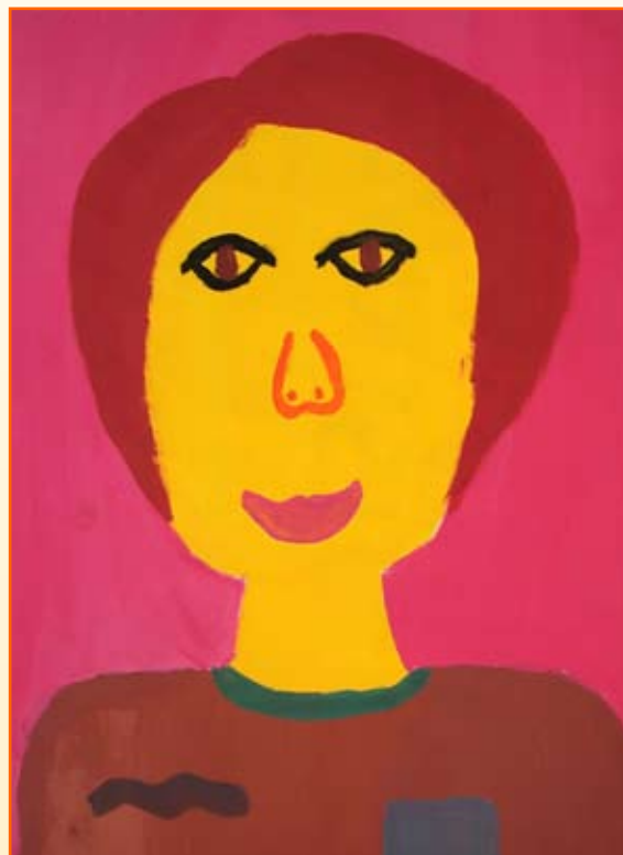
Katja Fištravec, 4. r