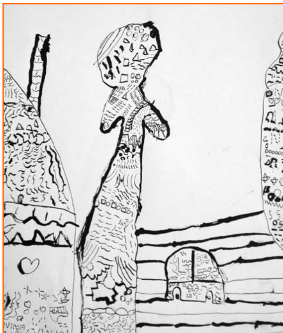
Nina Osojnik, 7. r/9