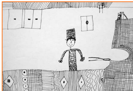
Simon Slanič, 5. r