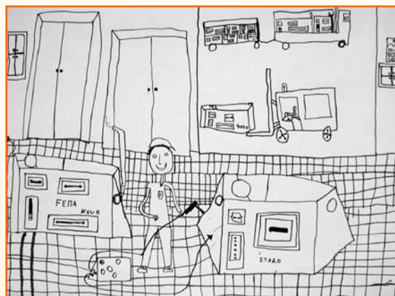
Jožek Zorko, 5. r