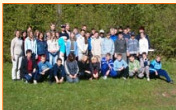
Udeleženci šole v naravi, 7. a in 7. b.