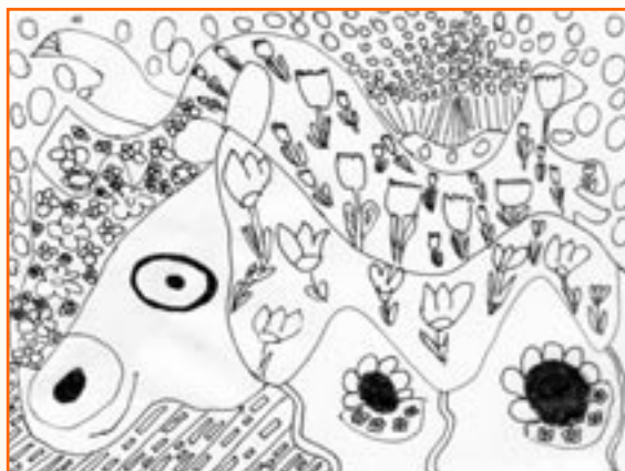
Blaž Živko, 7. a