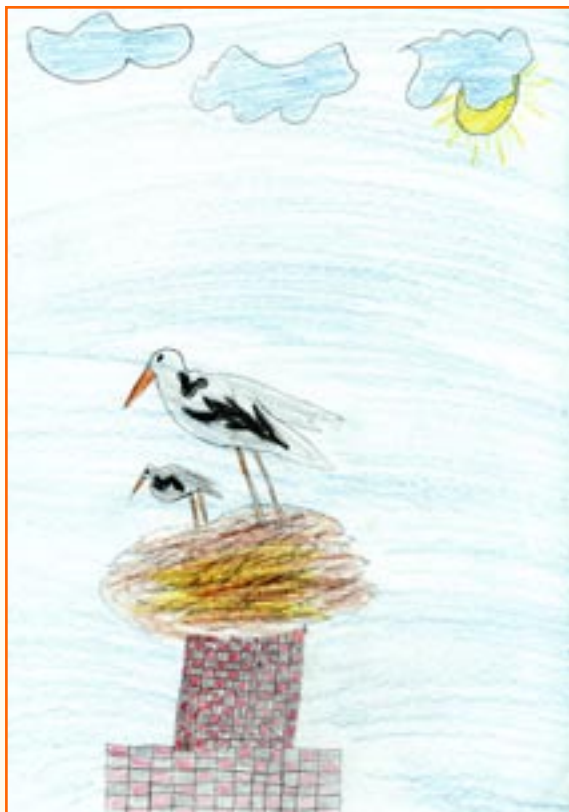
Davorin Slanič, 5. r