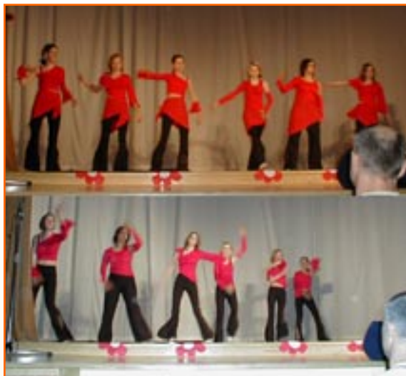
Naša plesna skupina Raglje.