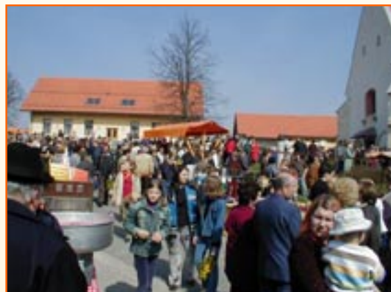
Cvetna nedelja (drugič).