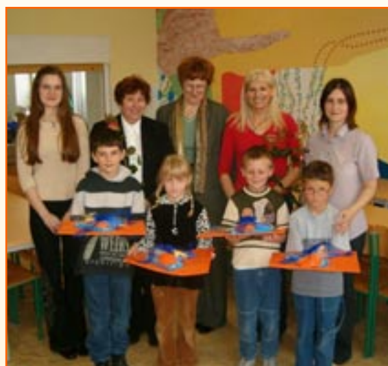
Nagrajenci likovne kampanije pod okriljem RK.