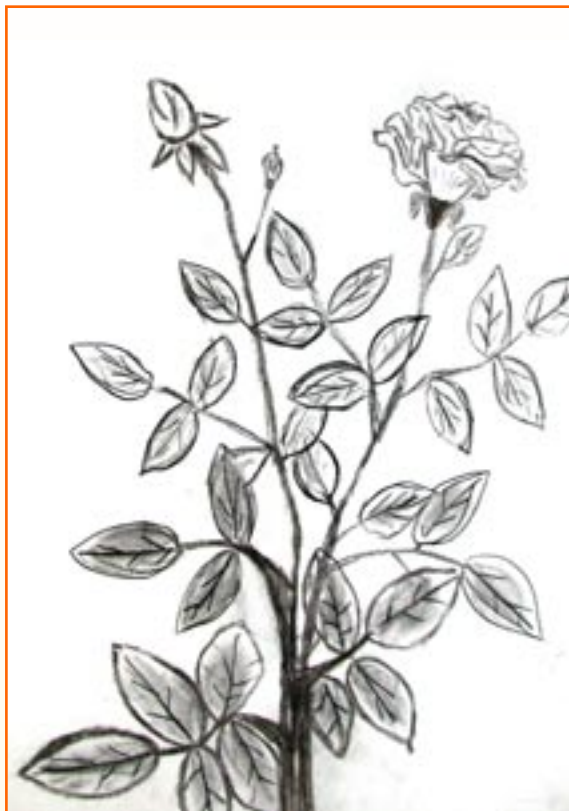
Anja Krajnc, 8. a