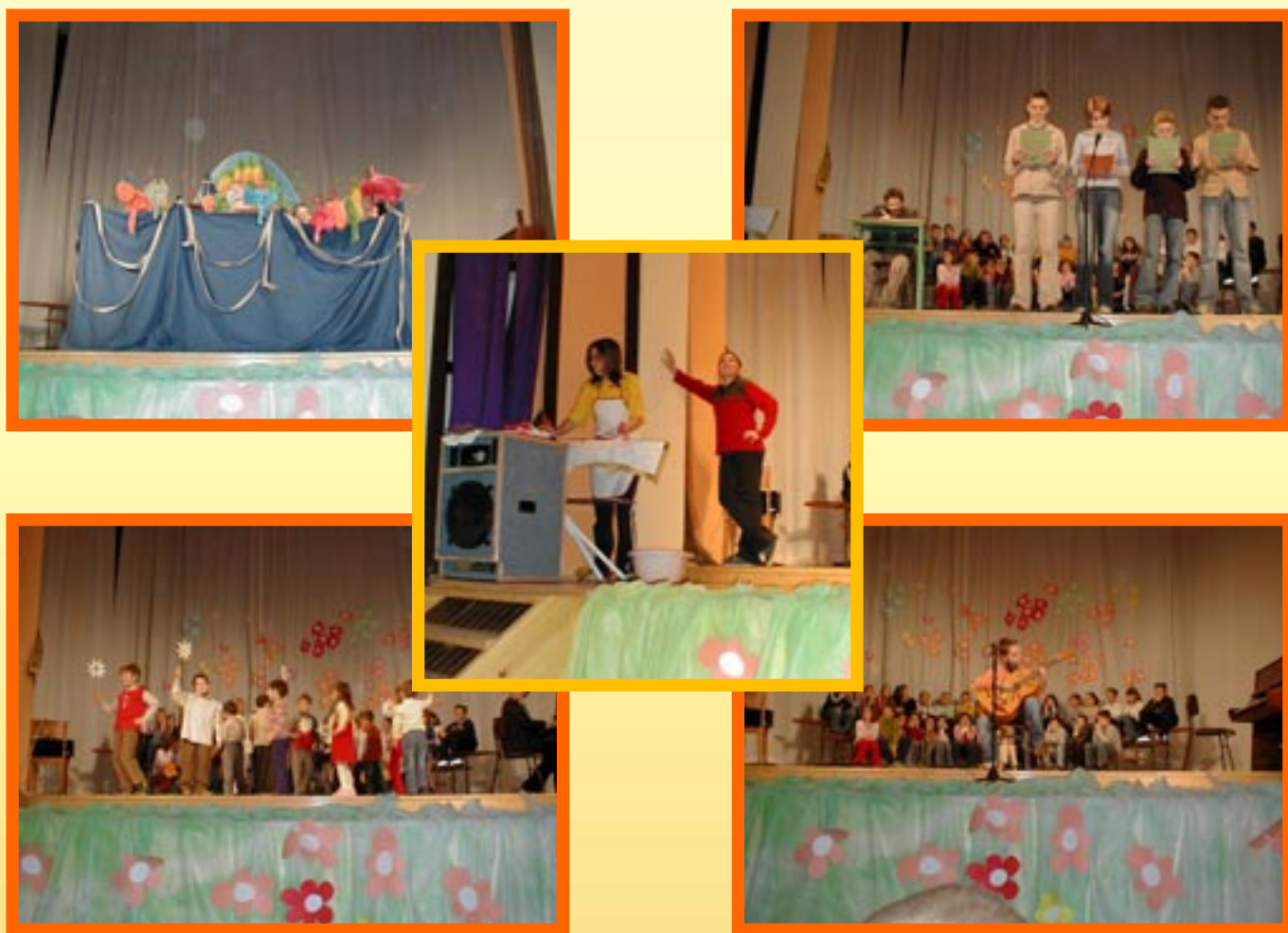
Šopek slik s proslave ob materinskem dnevu.

Učenci skupaj z učitelji so 25. marca ob materinskem dnevu pripravili proslavo za svoje mamice in babice.