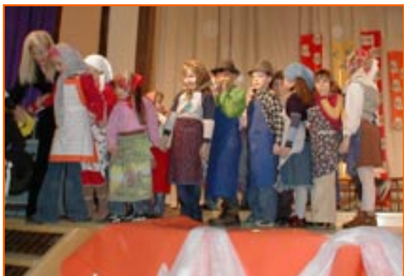
Priveditev ob kulturnem dnevu.