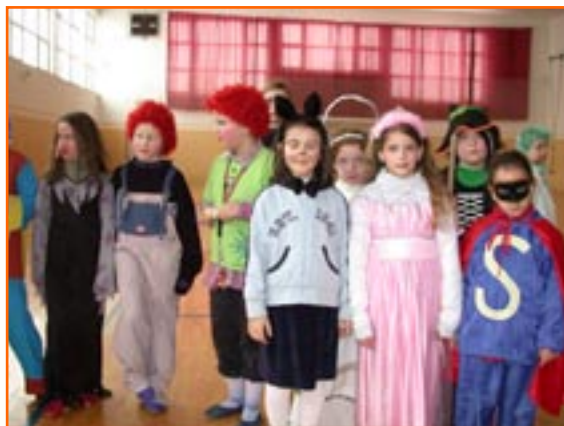
Očarljive male maske.

V torek, 24. 2. 2004, se je na naši šoli odvijalo že tradicionalno pustovanje. Dan se je začel s pustno povorko okrog novega naselja. Mimooidoči poštar nas je le stežka spoznal, saj nas je bilo večina našemljenih v domiselne maske. Domiselnost smo tudi nagradili in to v telovadnici, kjer smo rajali ter izbirali najlepše in najizvirnejše maske. Na nižji stopnji je žirija po težki odločitvi izbrala tri najboljše "fašanke".