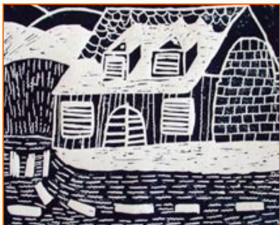
Dejan Gradišnik, 5. r

Sneg je zapadel in mi smo imeli športni dan. S smučmi in sankami smo se zbrali v šoli. V telovadnici smo se segreli z igro med dvema ognjema. Nato smo imeli malico ter topli čaj. Odpravili smo se na sneg. Imeli smo se zelo lepo. Le več takšnih športnih dni na snegu si želim.