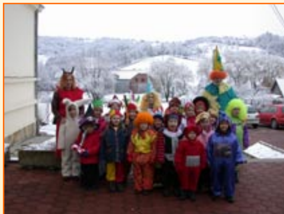
Maske z vrta.