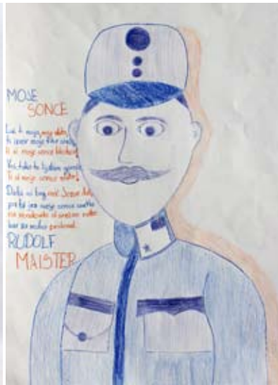
Ajda Vogrin, 5. a