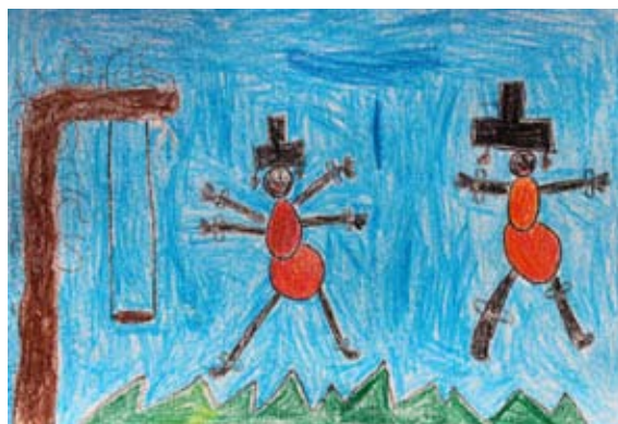
Nejc Grušovnik, 2. a