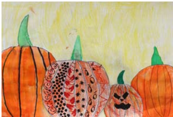
Ava Čuček, 5. a