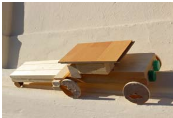
Filip Čas, 1. a