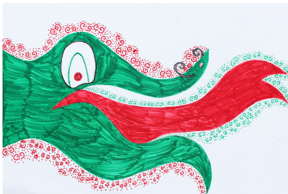
Neža Fras, 7. b