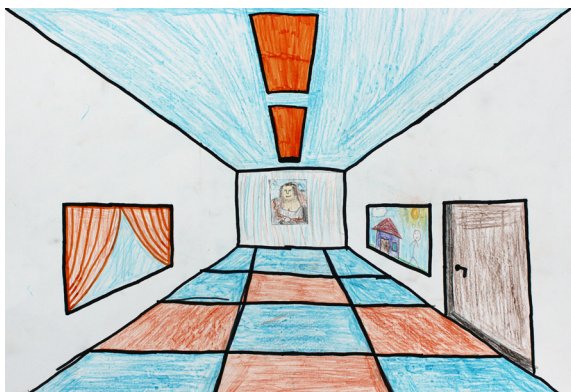
Timotej Kmetič, 8. a