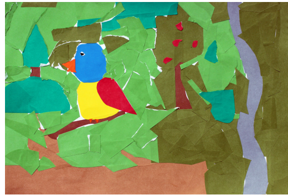
Lana Dolinar, 5. a