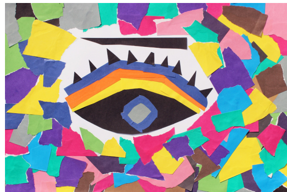
Maša Klevže, 5. a