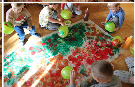
Otroci iz skupine Utrinki z vzgojiteljicami