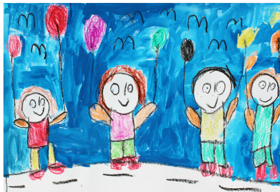
Sanja Greifoner, 3. a

bil naporen. Na izletu sem ugotovila, da je Finn dober pohodnik.