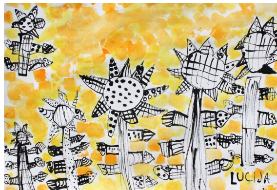
Lucija Gregorec, 3. a