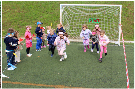
Otroci in vzgojiteljice skupine Mavrice