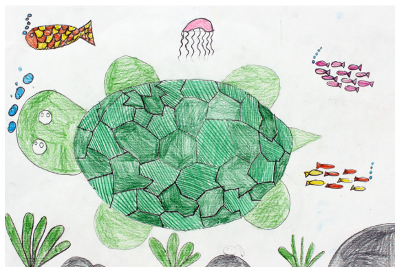
Lara Kmetič, 4. a