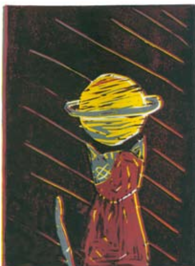
Taja Fistrovič, 7. a