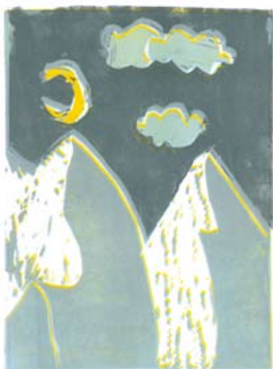
Avrelija Sužnik, 7. a