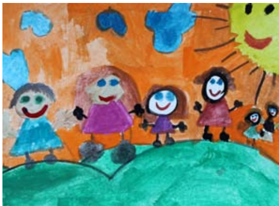
Maša Hribar, 2. a