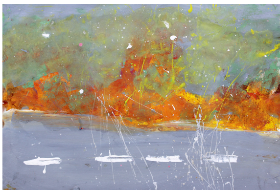
Nika Čuček, 6. b