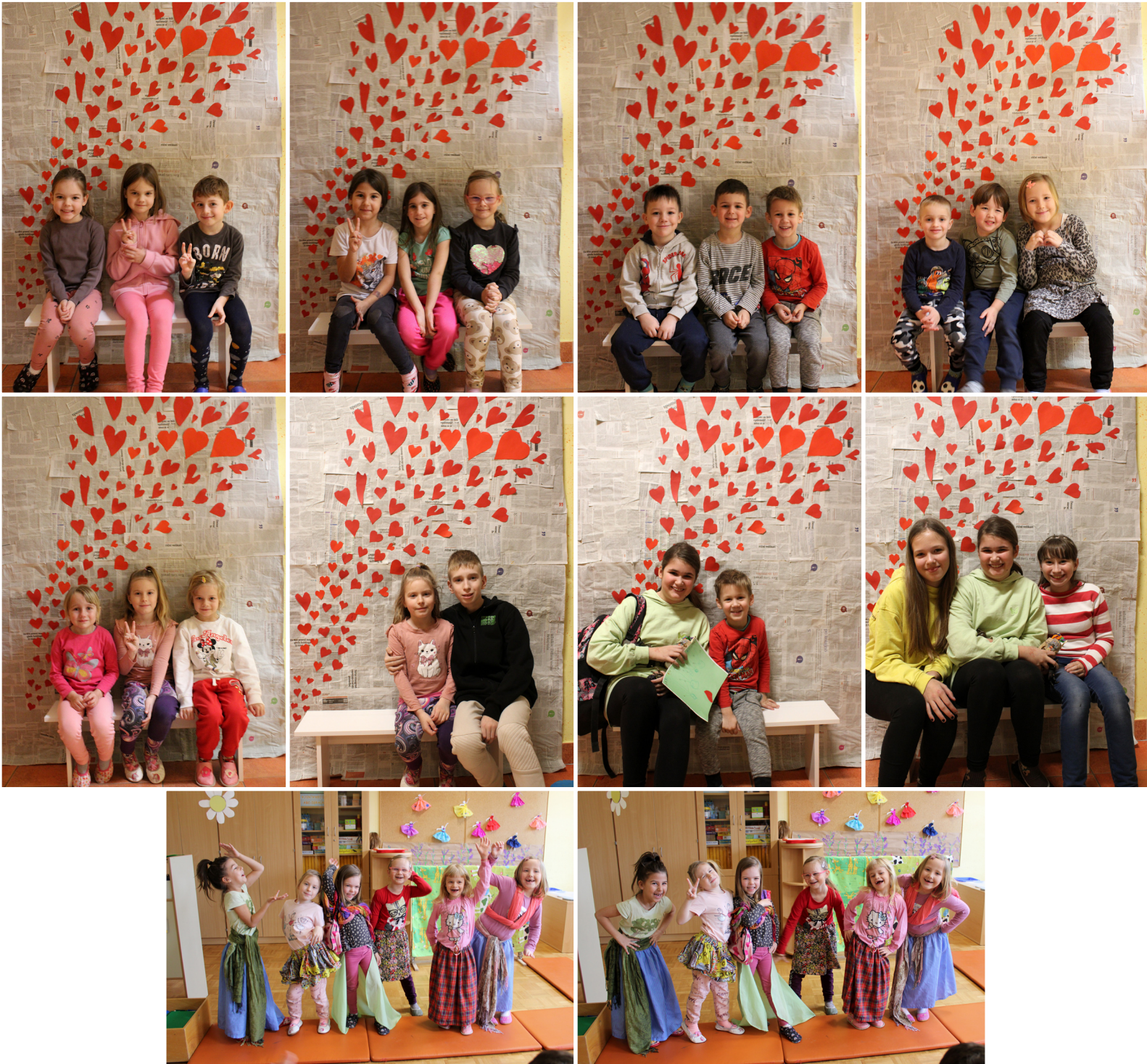
Otroci iz skupine Utrinki z vzgojiteljicama

Začni dan z nasmehom in bodi ustvarjalen, piši, riši, barvaj, izrezuj in raziskuj s prijateljem.