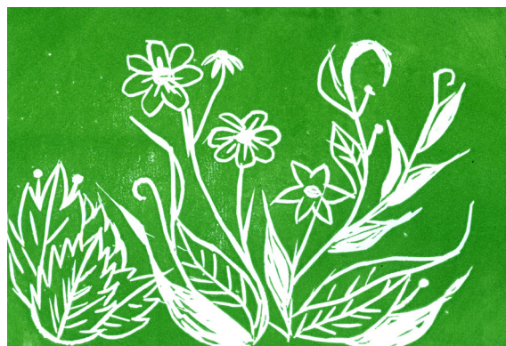
Lana Dajčman, 5. a

v grad. Ko je prišla, jo je napadel pes. Pes ni mogel premagati čarovnice, zato so jo obglavili. Poroka se je srečno nadaljevala. Kralj in kraljica sta bila zelo srečna. Soldat in princesa sta se srečno poročila.