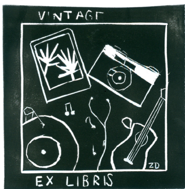
Zala Družovič, 9. a