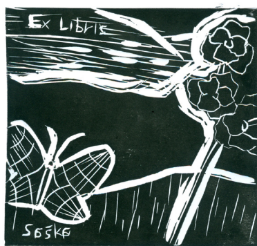
Saška Gavez, 9. a