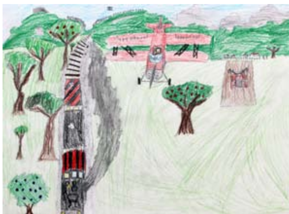
Tai Toplak, 5. a