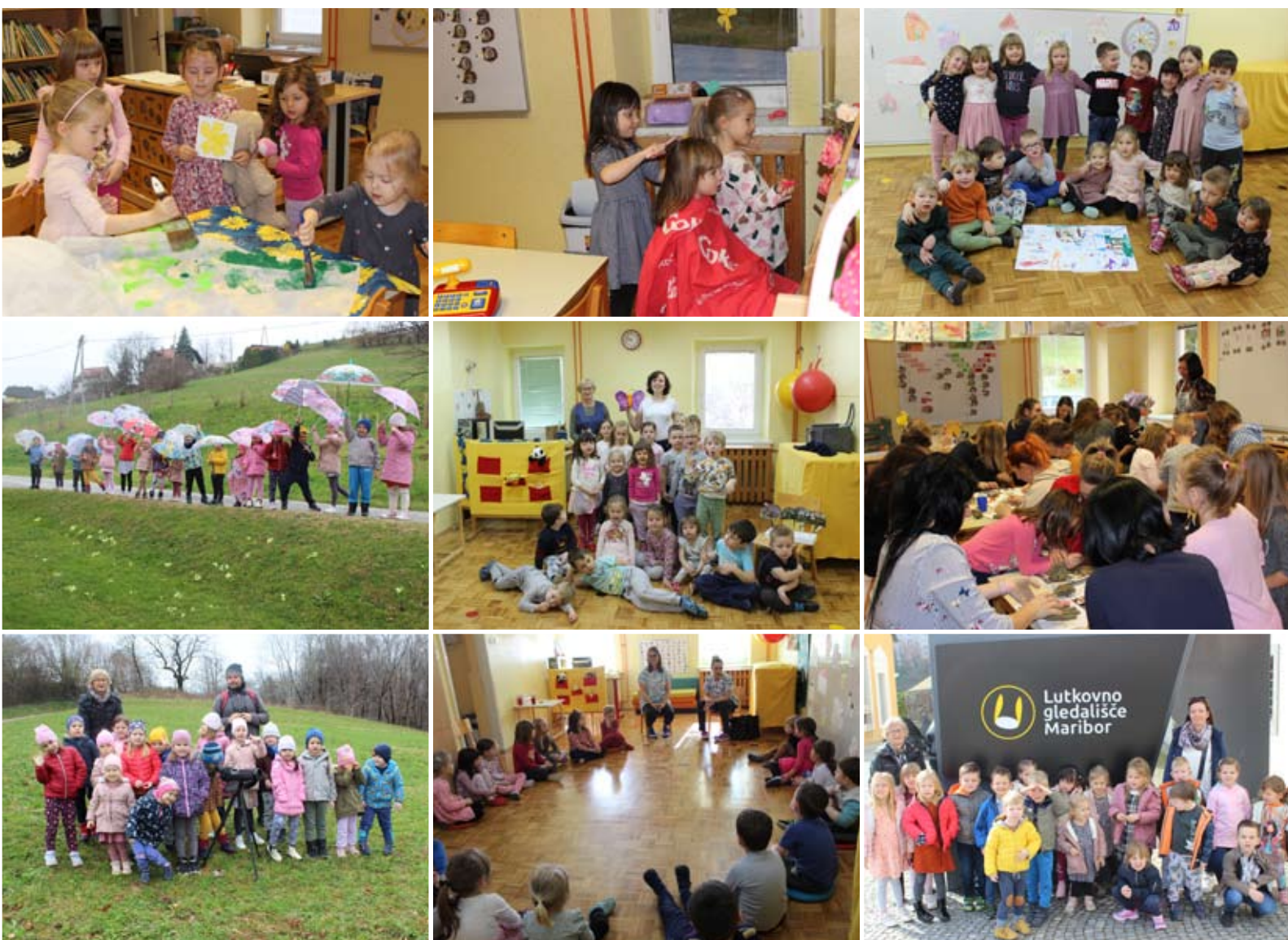
Otroci iz skupine Mavrice z vzgojiteljicami