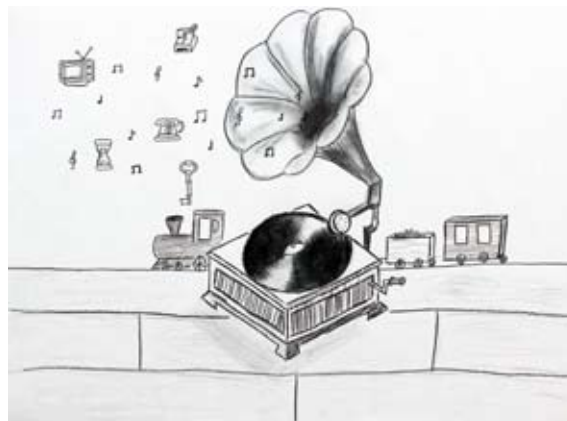
Neja Ditner, 9. b