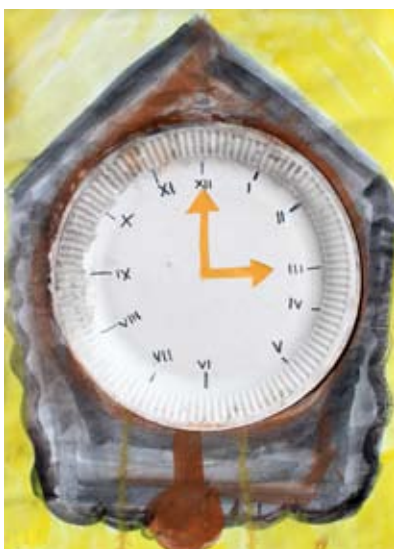
Pandora Pavlin, 3. a