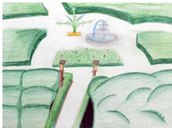
Lia Lucia Kmetič, 9. a

z njim, saj mi prej nihče ni bil po volji. Srečna nisem bila, še zdaleč od tega. Bila sem na robu obupa. Takrat sem zagledala majhno odprtino prekrito s koralami. Začela sem kopati pot iz te sobane. Ko je to mladenič videl, me je skušal ustaviti, a sem ga udarila z enim izmed okraskov iz lestenca. Izgubil je zavest in jaz sem končno izkopala pot od tod.