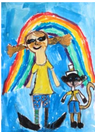
Anastazija Kralj, 2. b