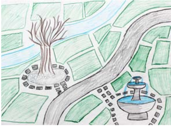
Zala Družovič, 9. a