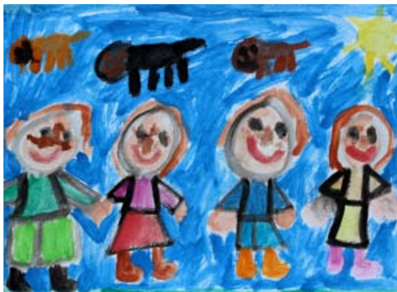
Lucija Gregorec, 2. a