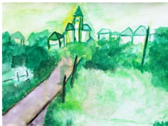
Zoja Mlinarič, 8. a

trudile splezati do pomaranč, ampak še opicam ni uspelo. Nato je flamingo dobil dobro idejo, da bi lahko poletel najvišje kar lahko in s kljunčkom vrgel majhen star kokos v pomarnčo in bi padla na tla. Flamingo je točno to storil. Tako je kapibara ugotovila, da bo morala včasih vložiti nekaj truda, če hoče kaj doseči.