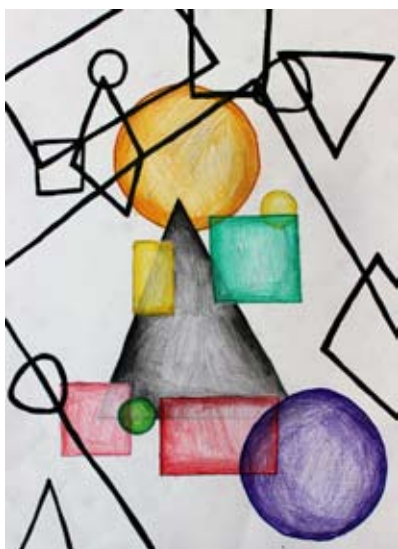
Gaja Rojs, 7. a