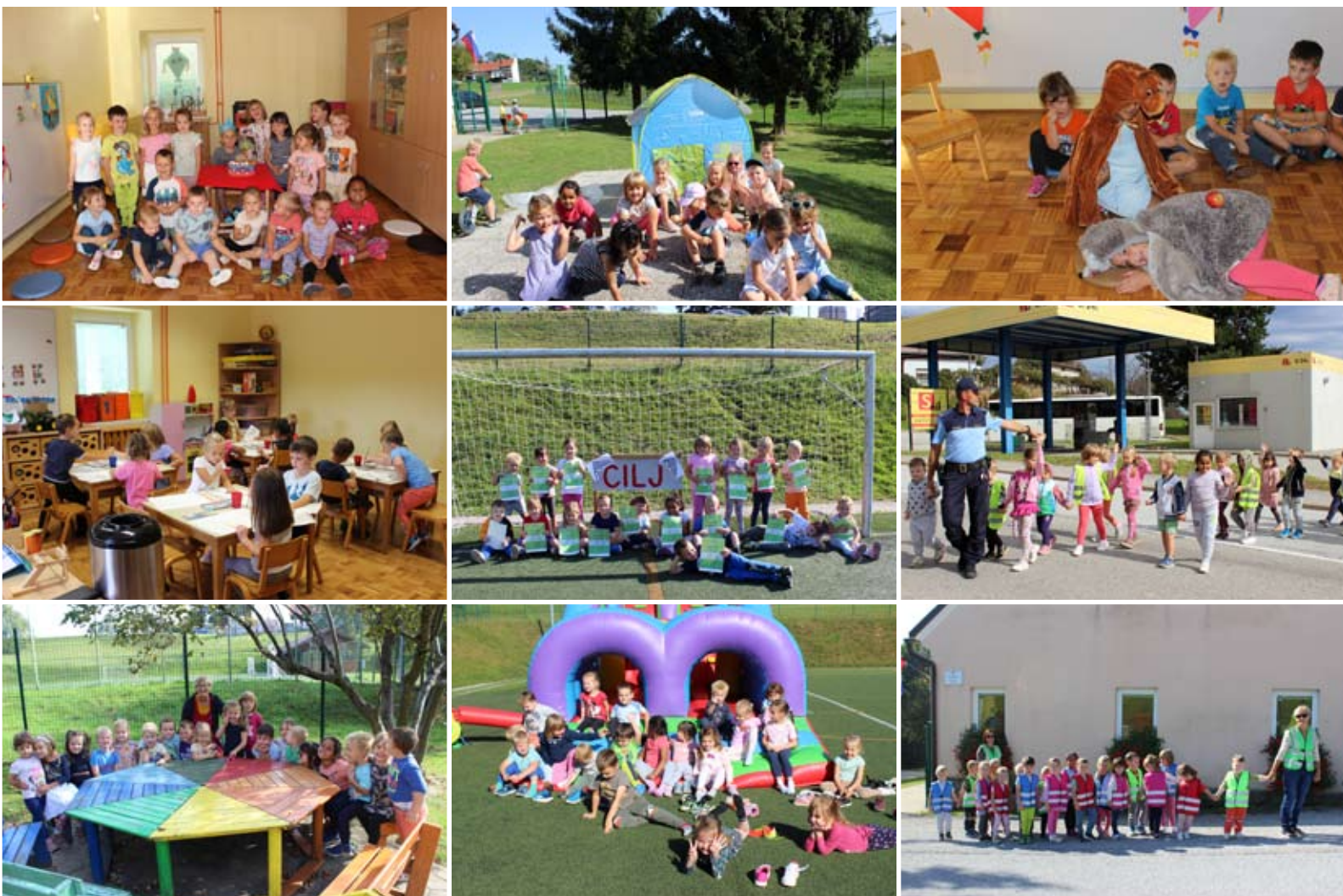
Otroci z vgojiteljicama skupine Mavrice