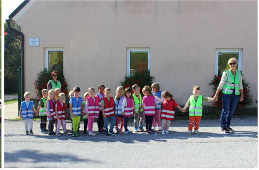
Otroci z vgojiteljicama skupine Mavrice