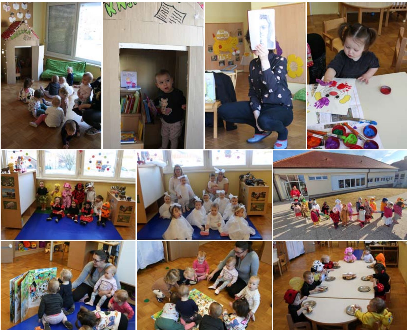
Otroci z vzgojiteljicama skupine Snežinke

Končuje se pustni čas, v katerem smo neizmerno uživali. Zelo zanimivo je bilo ustvarjanje z našimi majhnimi dlanmi, nastali so navihani pisani klovni. Veliko smo prepevali, rajali z ostalimi skupinami iz vrtca. Izdelali smo si svojo skupinsko masko Snežinke. Skupaj z obema skupinama jaslic smo se odpravili na krajšo povorko po Voličini. Upajmo, da bomo pregnali zimo in priklicali pomlad.