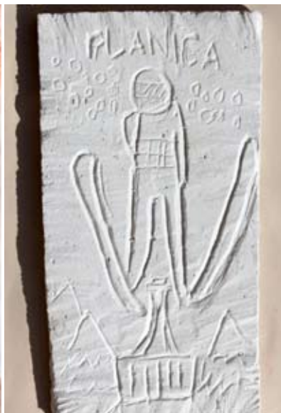
Žan Homec, 5. b