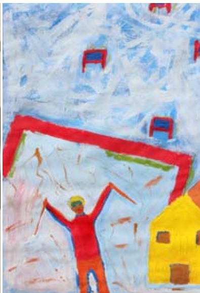
Ambrož Kurnik, 9. b