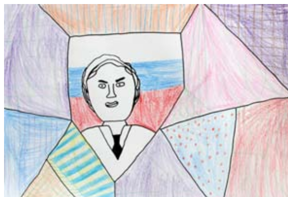
Filip Teodor Črešnar, 3. a