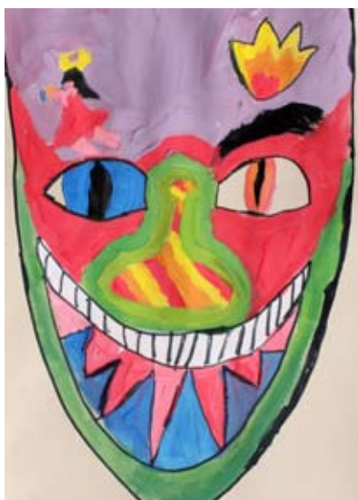
Klara Sužnik, 5. a