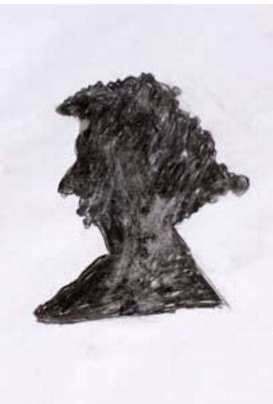
Filip Peja, 2. a