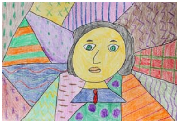
Neja Vogrin, 3. a