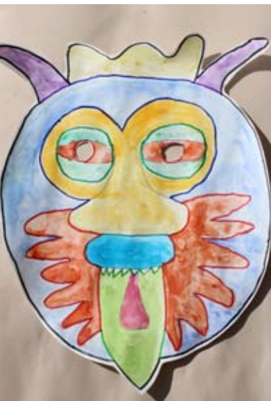
Džejna Aščerić, 5. a