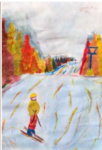
Tineja Rupnik, 9. b