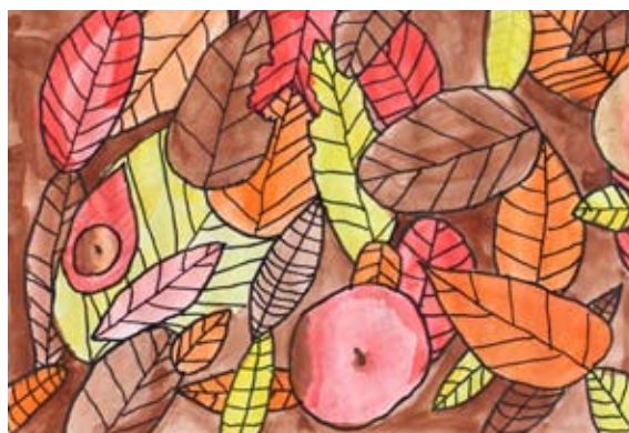
Matic Kunštič, 7. a