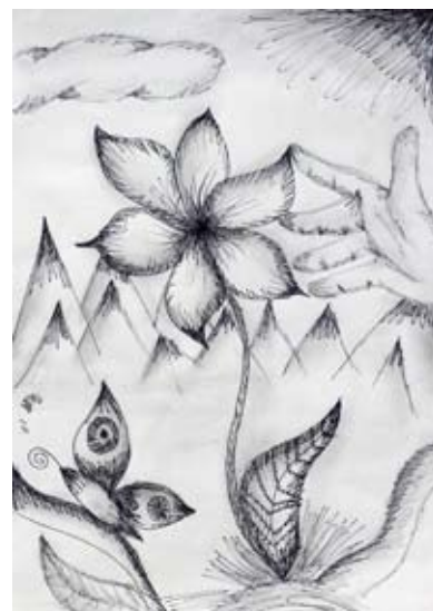
Merjema Aščerić, 8. b