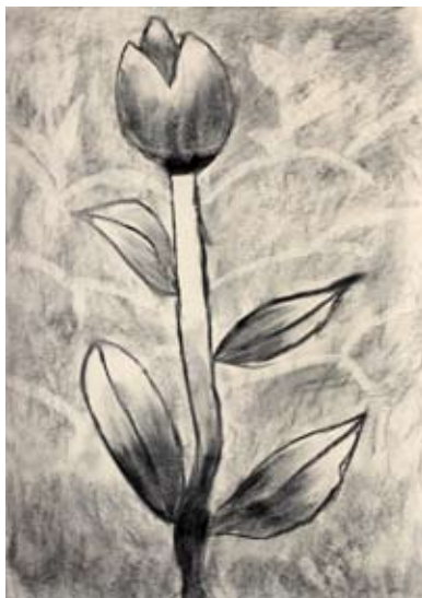
Klara Sužnik, 5. a