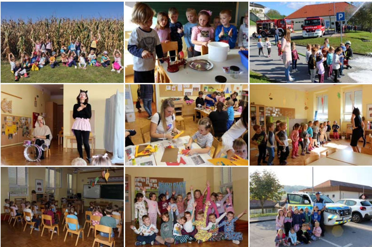
Otroci z vgojiteljicama skupine Utrinki

Skupaj se imamo res dobro, čisto vsak dan!