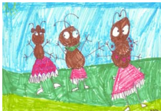
Enej Miklavžič, 2. a