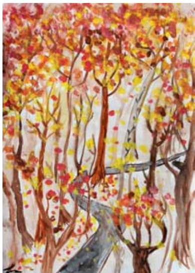
Lucija Sivec, 7. a