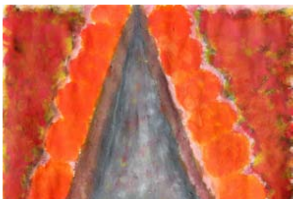
Taja Fistrovič, 6. a