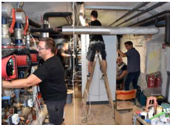
Montaža nove toplotne črpalke