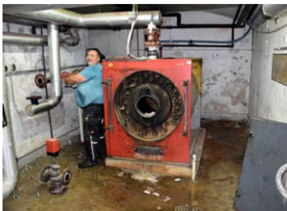
Peč na kurilno olje iz leta 1997

Če se pri šolskem delu kje zatakne, je prav, da vašemu otroku pomagata in ga bodrita ter vzpodbujata. Povejte mu, da je težko, vendar on to zmora in zna, seveda pa mu povejte, da se mora potruditi. Nikakor ni prav, če njegovo delo, ki ga zmora opraviti sam,