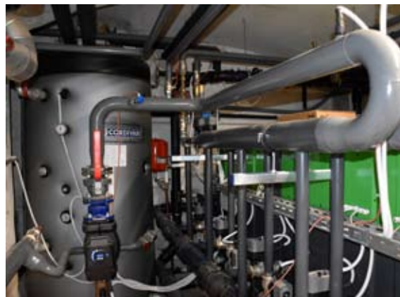
Pogled na zalogovnik in toplotno črpalko