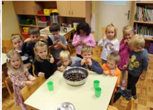
Otroci z vgojiteljicama in vgojiteljem skupine Mavrice