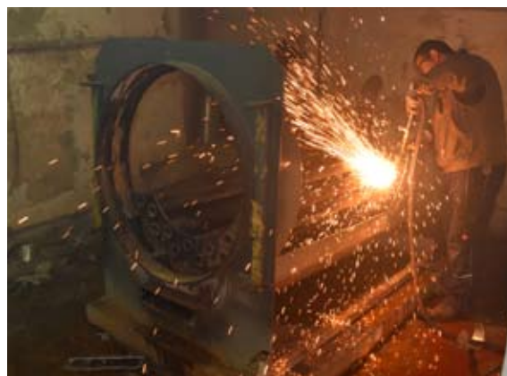
Razrez stare peči