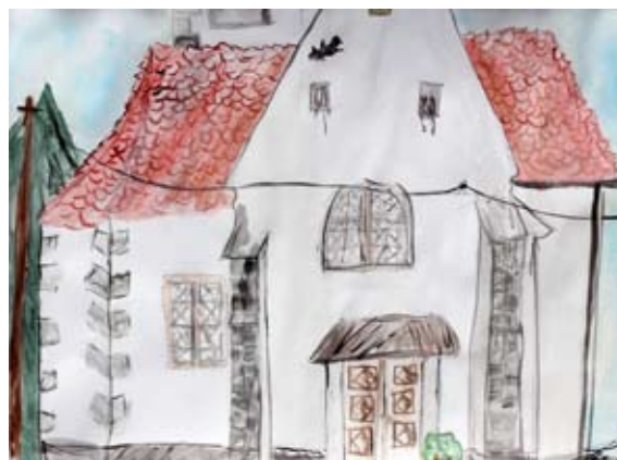
Lucija Sivec, 7. a