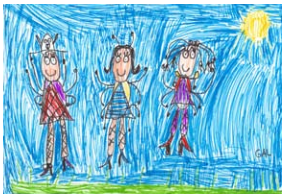
Gal Jug, 2. a

Šolarček izhaja zadnji šolski dan v mesecu, razen v času poletnih počitnic (julij in avgust). OŠ Voličina neprenehoma izdaja Šolarčka od decembra 1998, ko je izšla prva številka. V šolskem letu izide 10 števil. Brezplačno ga prejmejo vse družine, katerih otroci obiskujejo vrtec oz. šolo, vsi zaposleni in upokojeni delavci šole, vsi sponzorji, župan in drugi predstavniki Občine Lenart, častni občani Občine Lenart, ZRSŠ OE Maribor in MIZŠ. V imenu otrok, učencev, vzgojiteljic in učiteljev ter drugih zaposlenih se iskreno zahvaljujemo vsem staršem donatorjem in vsem sponzorjem, ki sodelujete v zelo uspešni in pomembni zgodbi izdajanja šolskega glasila Šolarček. OŠ Voličina ima v začetku šolskega leta 2022/23 vpisanih 223 učencev v 13 oddelkih, od tega se 2 učenca izobražujeta na domu. Organizirane imamo 4 skupine podaljšanega bivanja v skupnem obsegu 68 ur na teden. Vrtec v začetku septembra obiskuje 95 otrok, ki so razporejeni v 6 skupin.