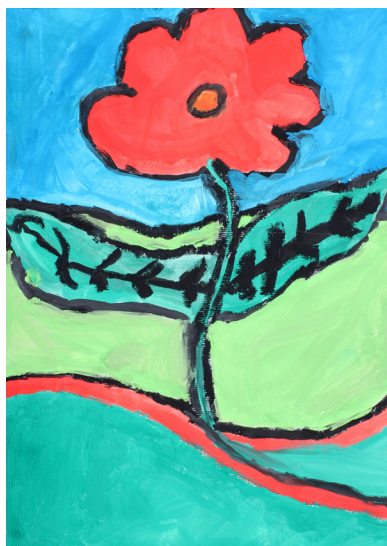
Luka Simonič, 6. a