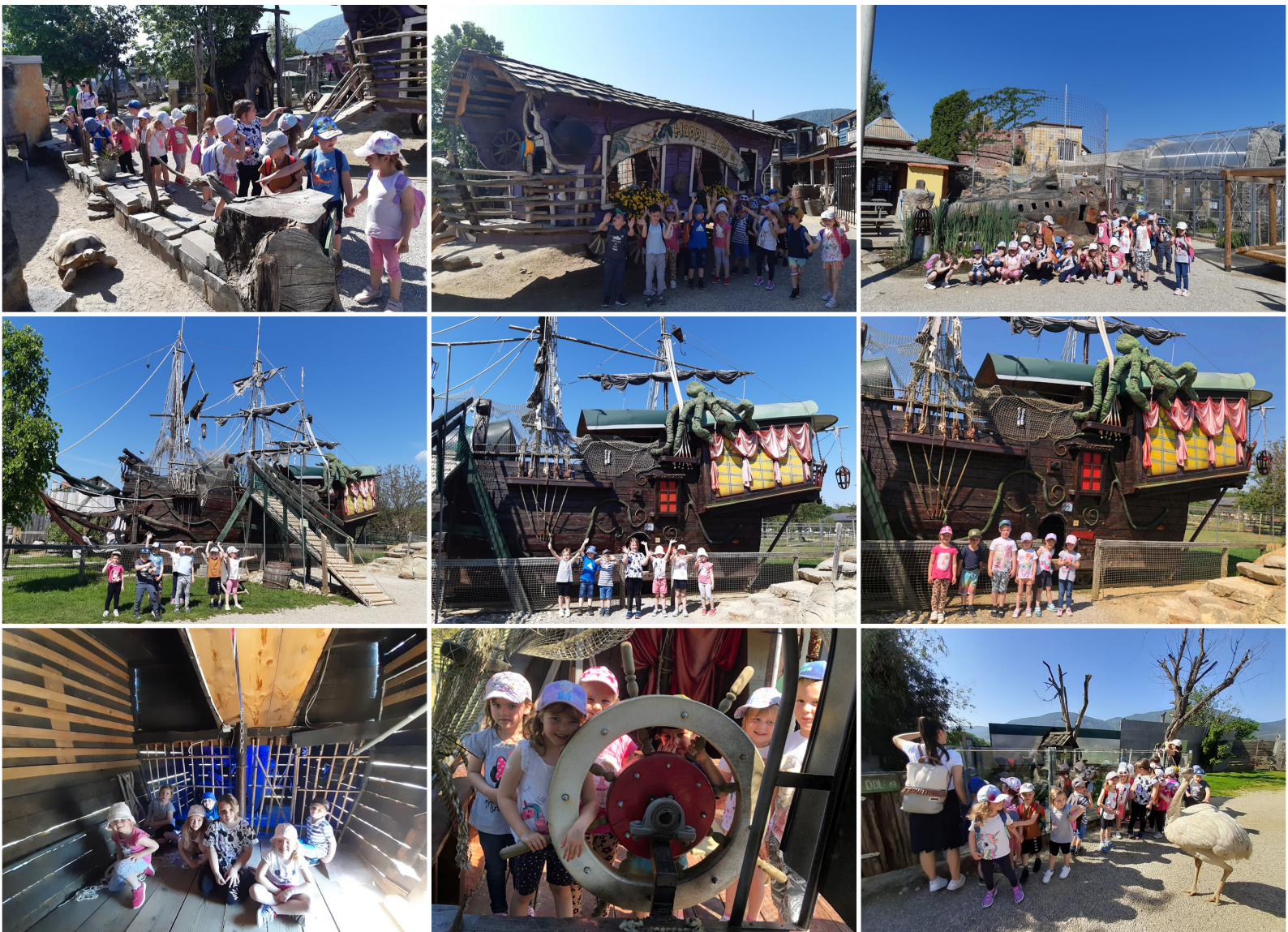
Otroci z vgojiteljicama skupine Sončki

ladjo, v kateri smo videli pravi gusarski zaklad, preizkusili smo se lahko v vrtenju krmila in na vrhu ladje pozvonili na zvonec. Ogledali smo si tudi zapornike na gusarski ladji in strašljive duhce. Nadaljevali smo z raziskovanjem igral. Nekateri izmed nas so se vrteli na vrtiljaku iz pletenih košarah, drugi pa se odpravili na leseni razgledni stolp. Najpogumnejši so se sprehodili čez lesen viseči most, od koder je bil lep razgled na zipline. Ob koncu smo se skupinsko fotografirali za spomin in se z avtobusom odpeljali nazaj proti vrtcu. Na poti smo se ustavili v sladolearni Kremko Duplek, kjer smo se osvežili s sladoledom. Utrujeni in polni doživetij smo se vrnili v vrtec, kjer nas je že čakalo pozno kosilo.