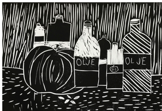
Lucija Sivec, 6. a