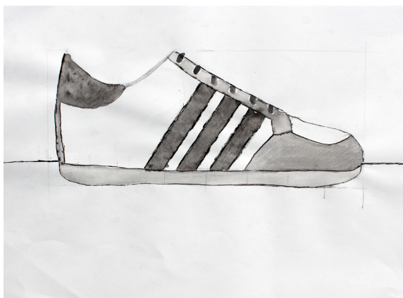
Julija Horvat, 8. a

Tekla je k oblaku in ga prosila, da spusti dež. Oblak jo je prosil, da ga razveseli in mu zapoje.