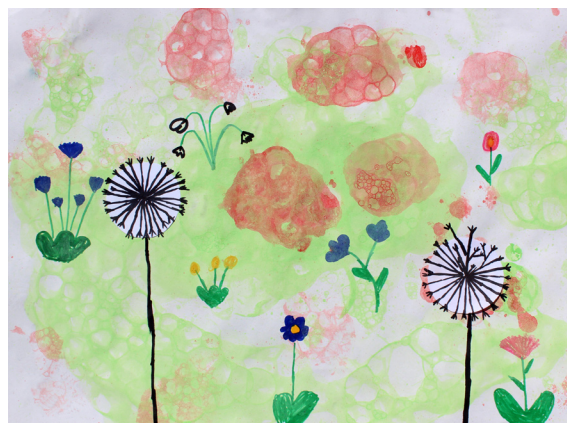
Tija Žnidarič, 4. b

Kralj jo je s svojo stražo spodil iz gradu. Vitezom je naročil, da morajo zelo paziti na princesko. Ker je princesa bila igriva, vesela in radovedna deklica, je vsaki dan zahajala na vrt. Na vrtu je zagledala majhen predor. Seveda se ni mogla upreti, da ne bi zlezla vanj in pogledala, kam vodi. Pot jo je vodila do hiše hudobne čarovnice. Čarovnica je bila zelo vesela, saj je na ta dan čakala dolgih devet let. Sklenila je, da bo princesko uporabila kot služkinjo pri njej doma. Ko je čarovnica šla po opravkih, se je pred vrati znašel majhen škrat. Ker je bila princesa zaklenjena v hiši, je škrat prišel, da ji pomaga pobegniti od tod, saj ni hotela ostati v tisti hiši. Škrat se je odločil pomagati princesi in takoj odhitel do gradu h kralju, da mu pove, kje se nahaja princeska. Kralj je takoj prišel do princeske