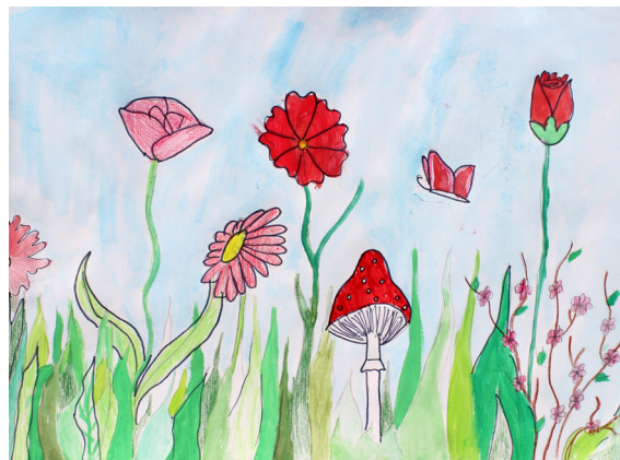
Lucija Sivec, 6. a

sebi domov, kjer je za njega skrbela devet dni.