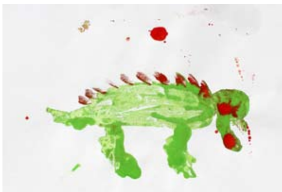
Gal Jug, 1. a