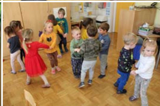
Otroci z vzgojiteljicama skupine Lunice