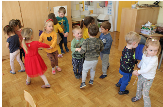
Otroci z vzgojiteljicama skupine Lunice