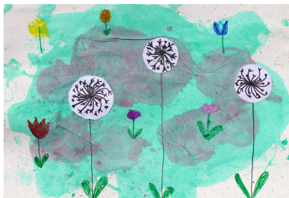
Nika Čuček, 4. b