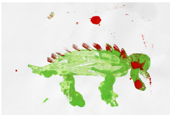
Gal Jug, 1. a