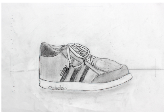
Tineja Rupnik, 8. b