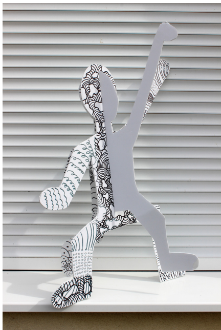
Kiparski prostor, 7. b