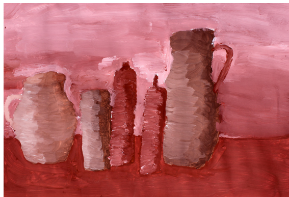
Mellanie Trinkaus, 8. a