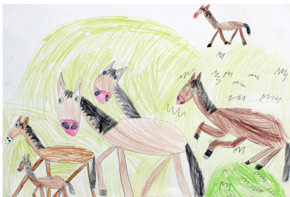
Neja Vogrin, 2. a