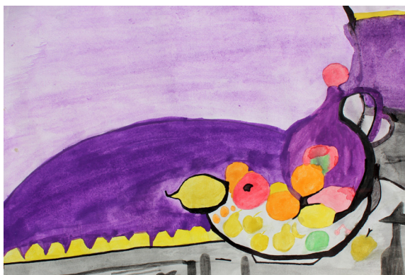
Amina Ćoralić, 8. b