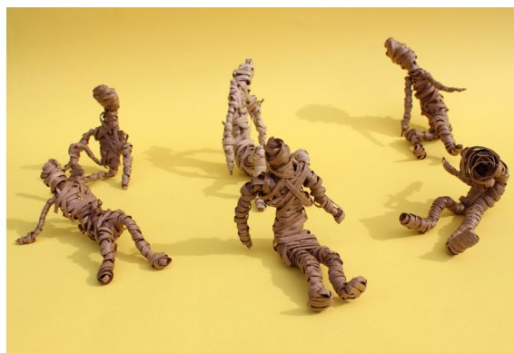
Obhodni kip, 6. a