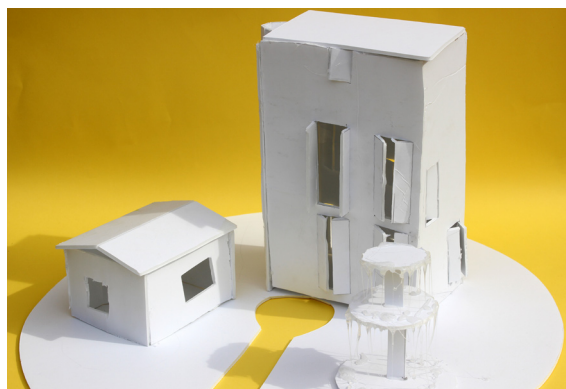
Prostorsko oblikovanje, 7. b