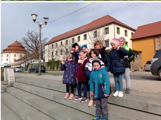
Otroci z vzgojiteljicama skupine Utrinki