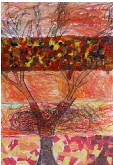
Penelope Pavlin, 4. a