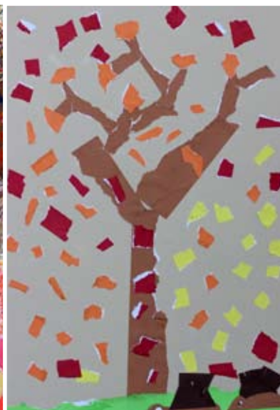
Pandora Pavlin, 1. a