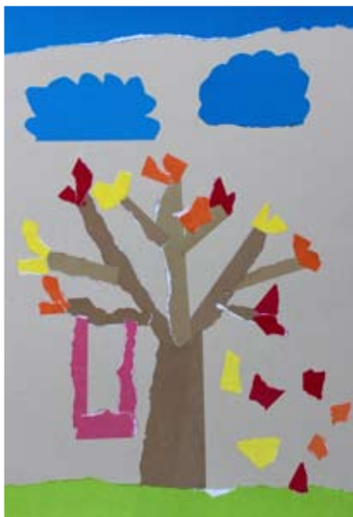
Nika Poštrak, 1. a