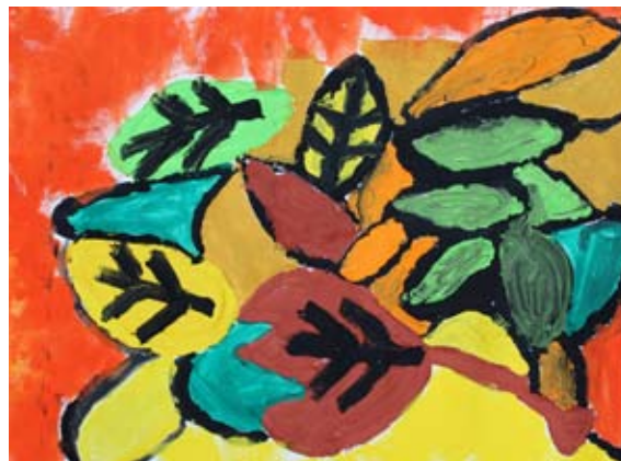
Jure Kapun, 5. a