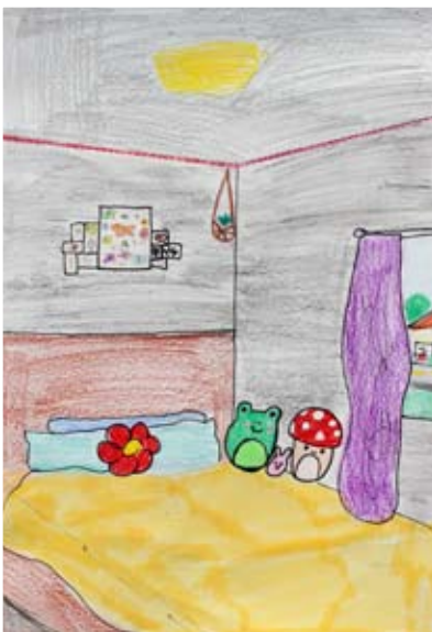
Tineja Rupnik, 8. b