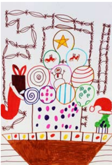
Jure Kapun, 5. a