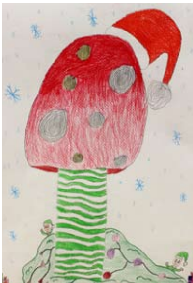
Iva Cerovšek, 5. a