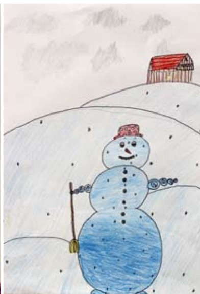
Gaja Rojs, 5. a