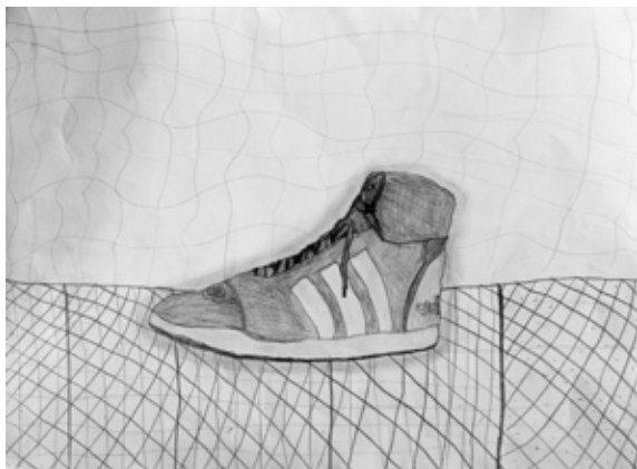
Benjamin Ferk, 4. a