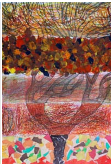
Klara Sužnik, 4. a