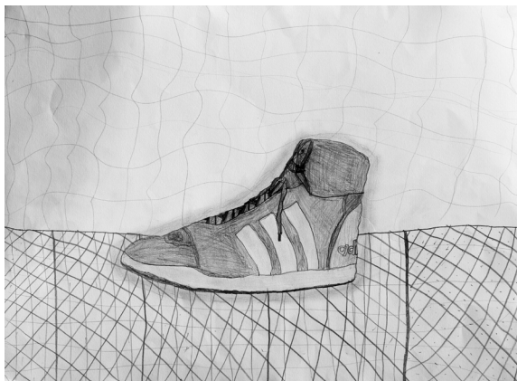
Benjamin Ferk, 4. a