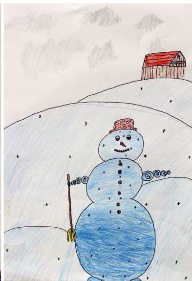
Gaja Rojs, 5. a