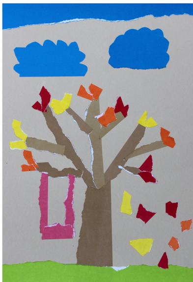
Nika Poštrak, 1. a