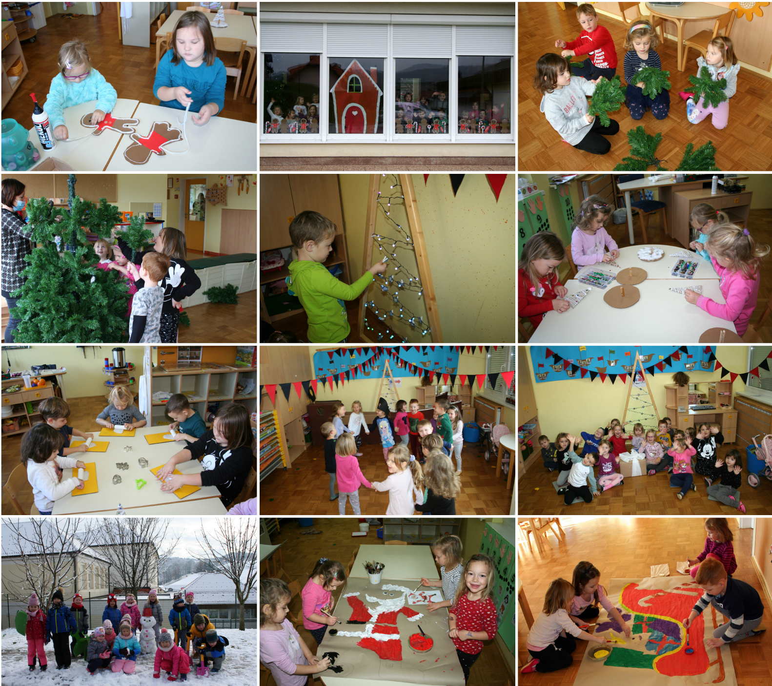
Otroci iz skupine Sončki z vzgojiteljicama