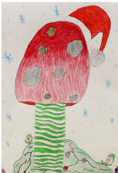
Iva Cerovšek, 5. a