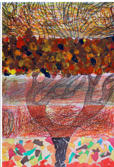
Klara Sužnik, 4. a