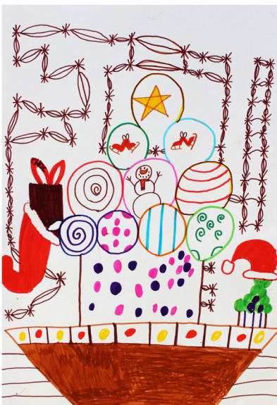
Jure Kapun, 5. a