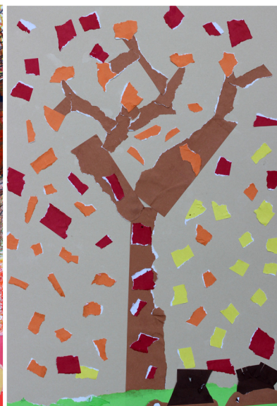
Pandora Pavlin, 1. a