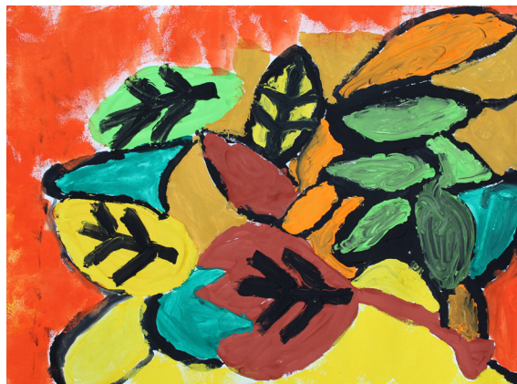
Jure Kapun, 5. a