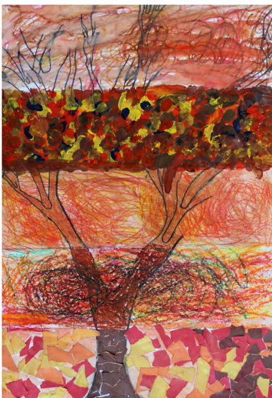
Penelope Pavlin, 4. a