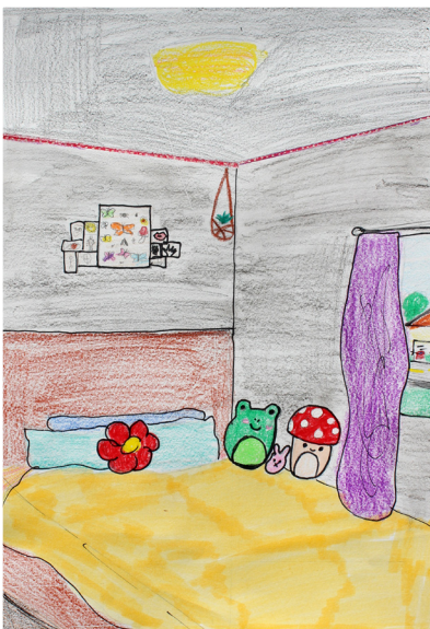
Tineja Rupnik, 8. b