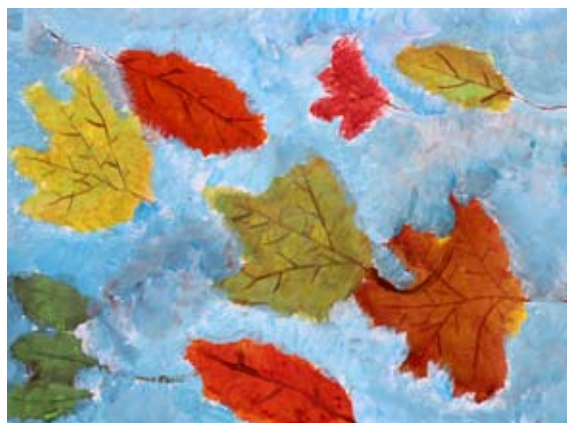
Tjaša Rojs, 5. a