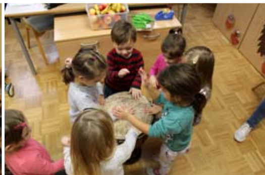
Igranje na džembo je glasno in zabavno.