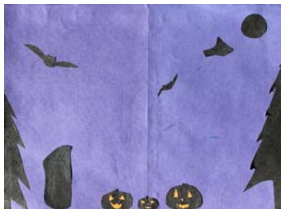
Ela Zaveršnik Trojner, 5. a