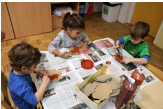
Le kaj bo nastalo?