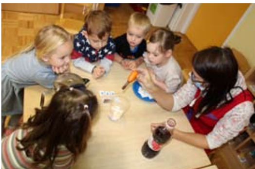
Male radovedne glavice sodelujejo ob poskusih.