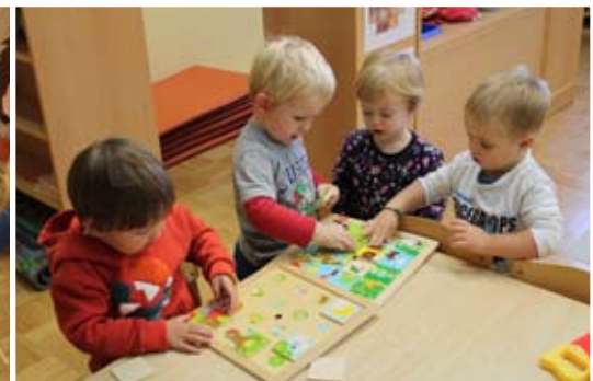
Skupaj rešimo vse.