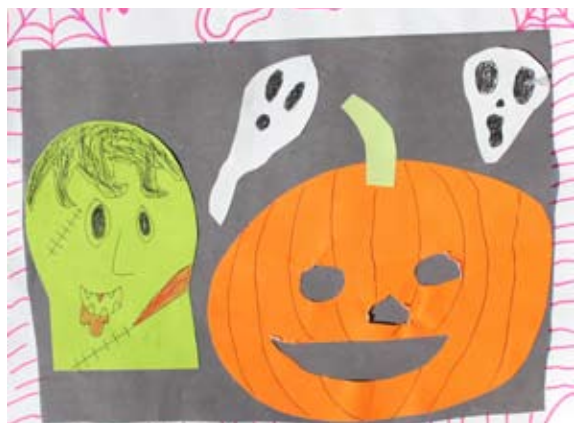
Jure Kapun, 5. a