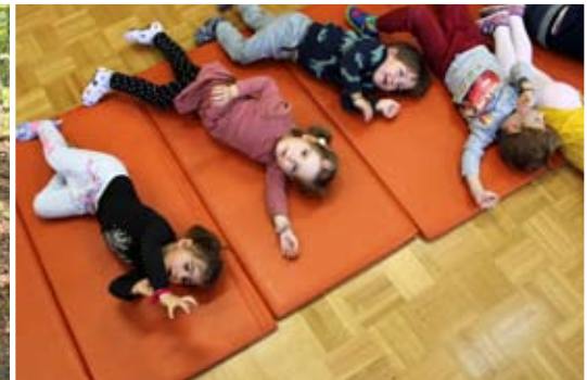
Ob deževnih dneh se giblujemo nekoliko drugače.