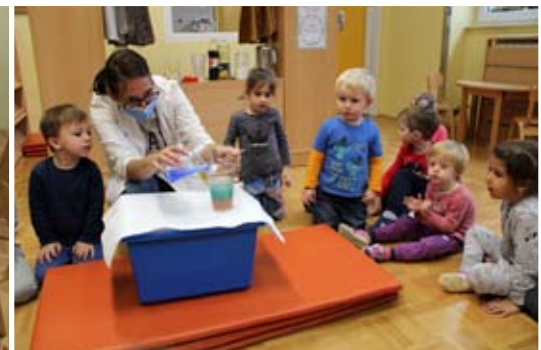
Male radovedne glavice sodelujejo ob poskusih.