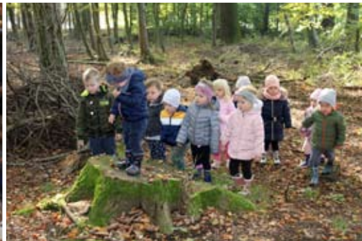
V gozdu moramo premagati veliko ovir.