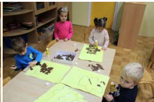
Le kaj bo nastalo?