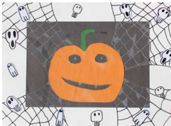
Timotej Kmetič, 5. a