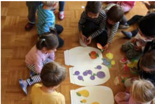
Marmelada nekoliko drugače

v prave male raziskovalce. Najzabavneje pa je ko v naših kotičkih postanemo mali očki in mamice, naše igrače pa »pravi« dojenčki. Ob spodnjih fotografijah si boste lažje predstavljali življenje pri Lunicah. Mi pa Vam pošiljamo lepe pozdrave in Vam vsem želimo mirne in srečne zimske dni.