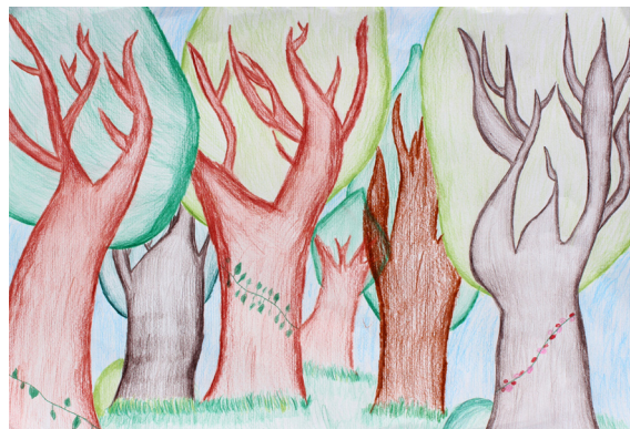
Iva Cerovšek, 5. a