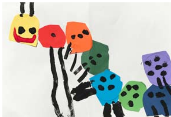
Maša Simonič, 3,5 leta (Gosenica)