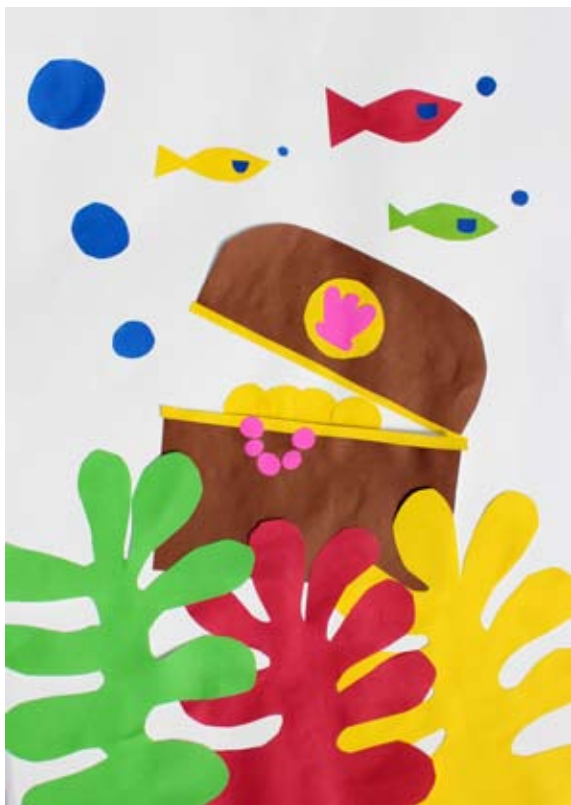
Eva Ornik, 5. a

Jaz sem pošastek, rad imam banano in imam boječo mamo. Bojim se strašnega smeha in soseda, ki šepa.