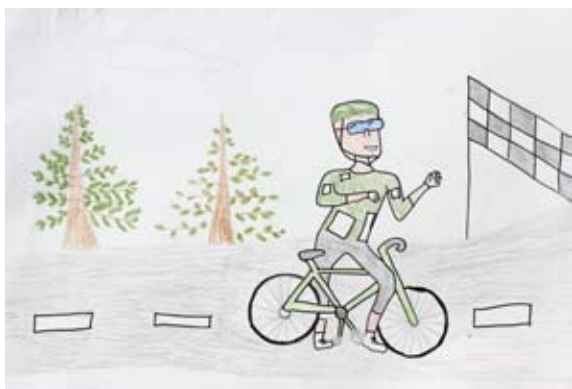
Eva Ornik, 5. a