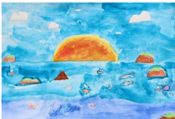
Matic Kunštič, 5. a