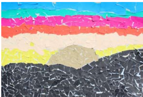
Lucija Sivec, 5. a