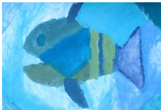
Timi Pfajfar, 5. a

zreda tudi pri pouku uporabljali zaščitne maske. Pred tem je bilo obvezno, da so zaščitne maske uporabljali v skupnih prostorih šole.