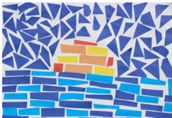
Teo Fekonja, 5. a

Vsi učenci so se od ponedeljka, 9. 11. 2020, naprej izobraževali na daljavo.