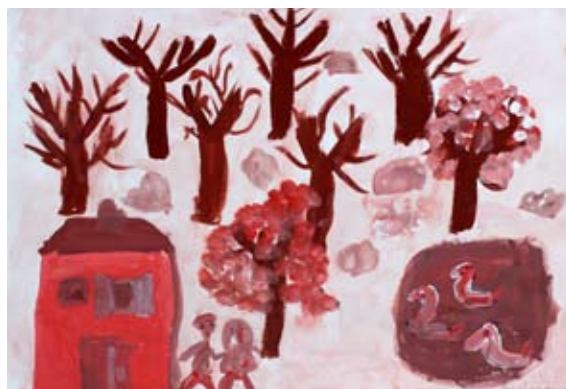
Penelope Pavlin, 3. a

kazali na raznih tekmovanjih in dosegli izreden uspeh na učnem, kulturnem, umetniškem ali športnem področju. OŠ Voličina čestita učencem za izjemne uspehe, ki so jih dosegli v šolskem letu 2020/21. Knjižne nagrade so prejeli: