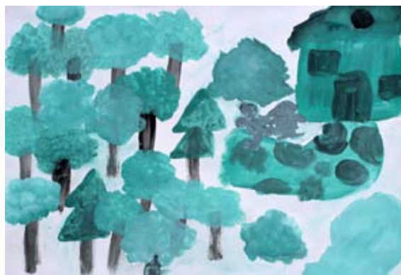
Liza Stergar, 3. a

kažejo drugim. V okviru mreženja strokovno rastejo.