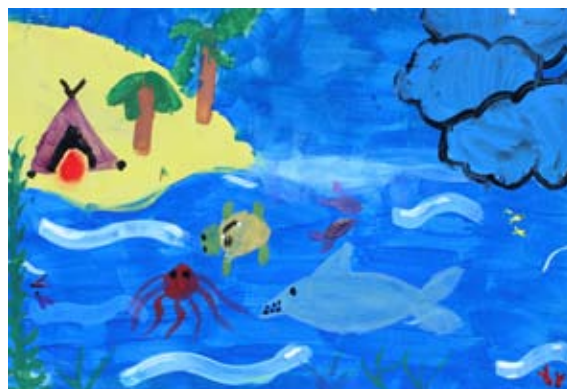
Iris Kramberger, 5. a

ma Iztoku Čopu in Luki Špiku ter strelcu Rajmondu Debevcu. Dan slovenskega športa spodbuja vrednote biti telesno aktiven, uživati življenje in skrbeti za dobro počutje.