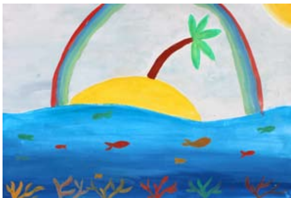
Eva Ornik, 5. a