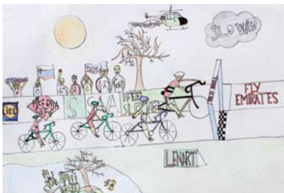
Ian Škamlec, 5. a