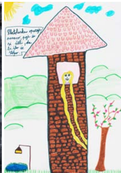
Zoja Mlinarič, 5. a