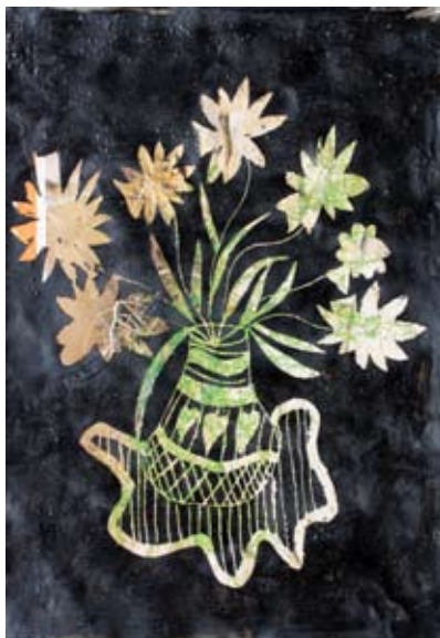
Klara Sužnik, 3. a