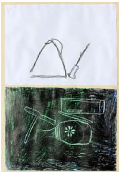
Filip Teodor Črešnar, 1. a