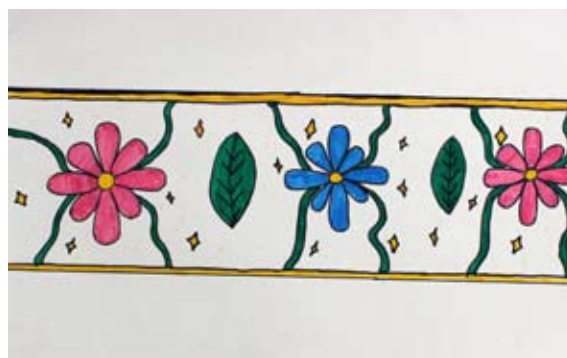
Zala Družovič, 6. a