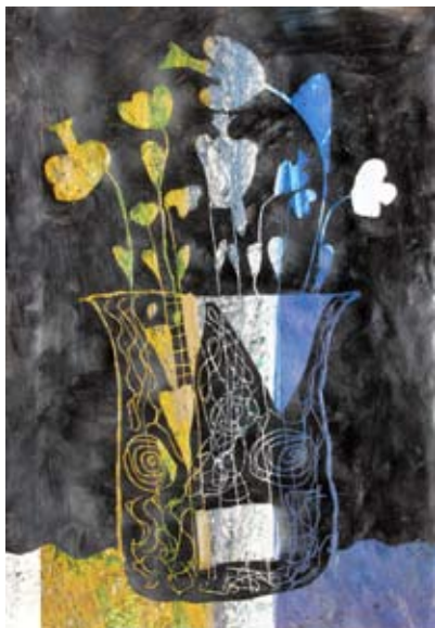
Paskal Rojko, 3. a