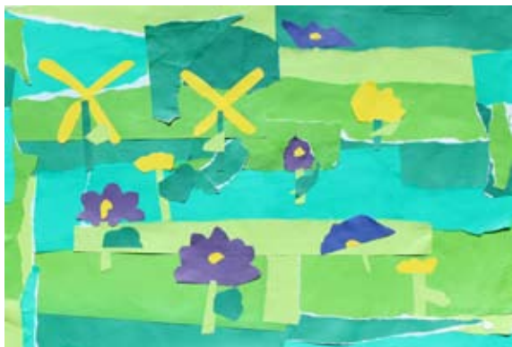
Ajda Vogrin in Ava Čuček, 1. a