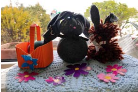
Učenci 4. a in 5. a