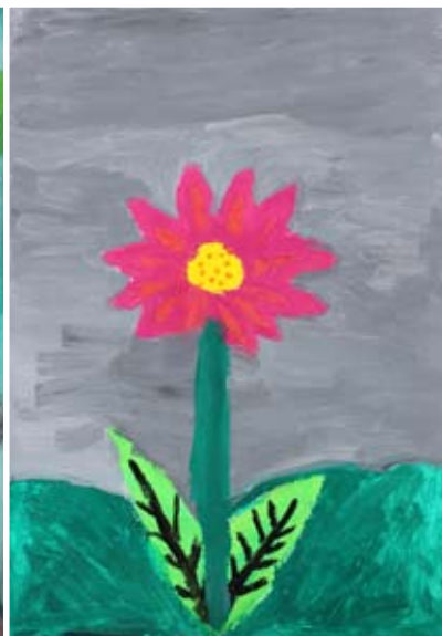
Lina Sekol, 5. a

Ob njem se vije potok, tam zagleda svoj odsev. Pa priplava ribica, na obrežju zareglja žabica.