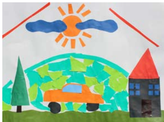
Gal Šilec Vogrin, 5. a