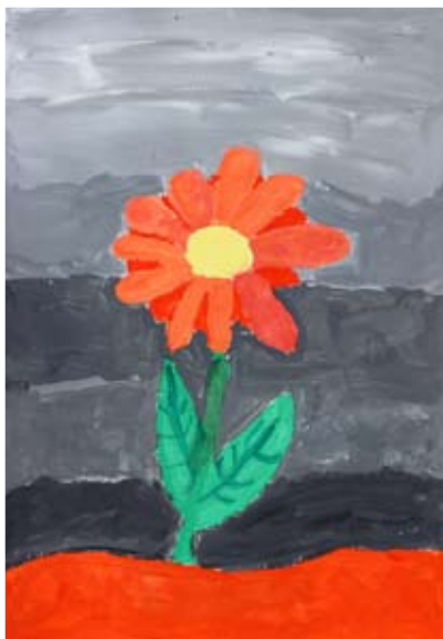
Zoja Mlinarič, 5. a