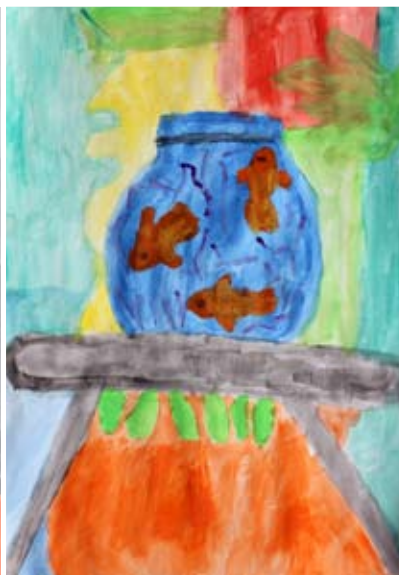
Tinkara Kocbek, 3. a