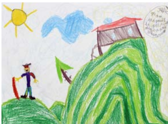
Svit Lorber, 5. a