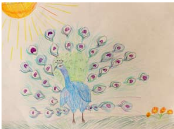
Lucija Sivec, 5. a