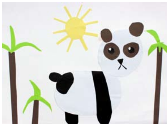
Lana Rupnik, 5. a