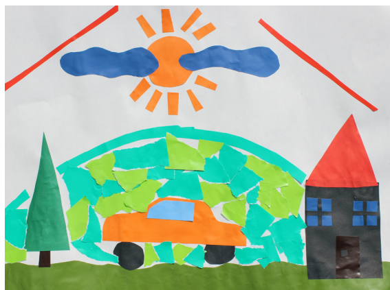
Gal Šilec Vogrin, 5. a