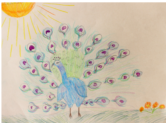
Lucija Sivec, 5. a