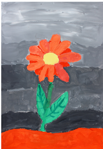
Zoja Mlinarič, 5. a