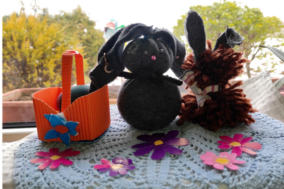
Učenci 4. a in 5. a