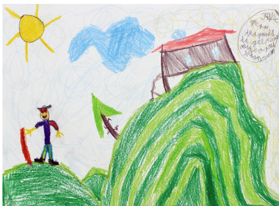
Svit Lorber, 5. a