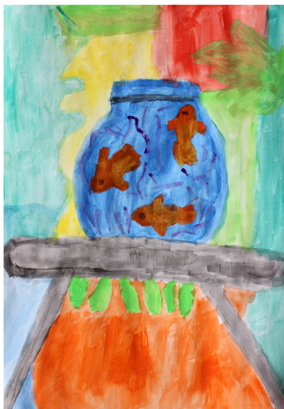
Tinkara Kocbek, 3. a