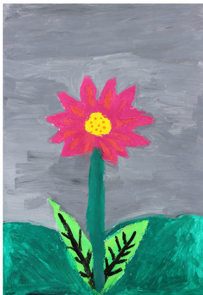
Lina Sekol, 5. a

Ob njem se vije potok, tam zagleda svoj odsev. Pa priplava ribica, na obrežju zareglja žabica.