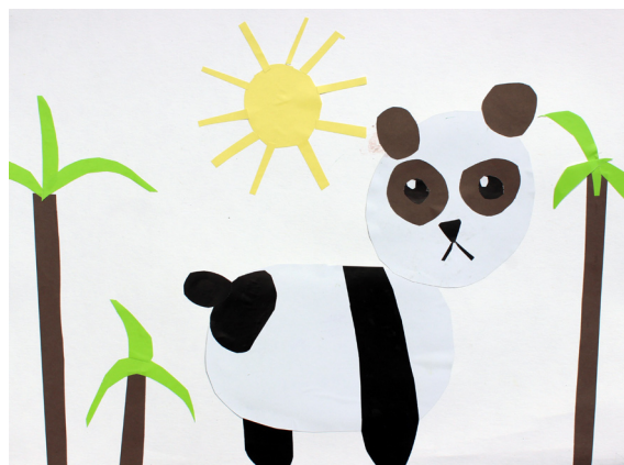
Lana Rupnik, 5. a