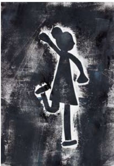
Tia Toplak, 3. a