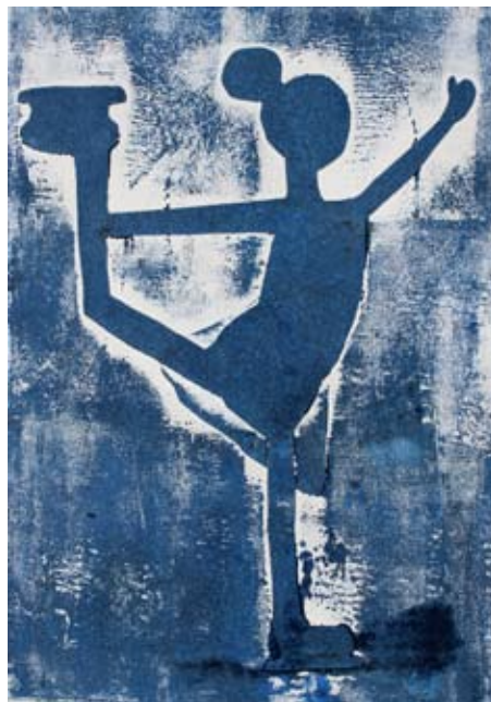
Klara Sužnik, 3. a