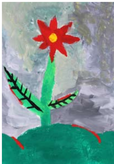
Matic Kunštič, 5. a