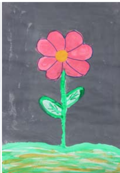
Teo Fekonja, 5. a