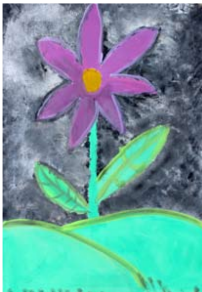
Lucija Sivec, 5. a