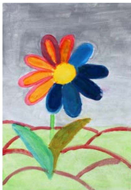
Eva Ornik, 5. a