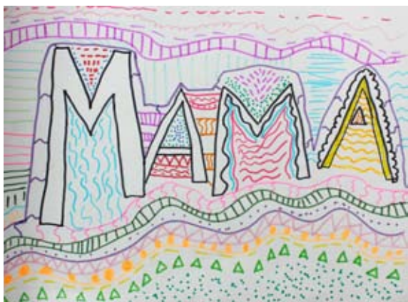
Zoja Mlinarič, 5. a