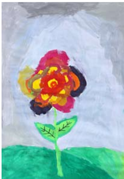
Maša Vogrin, 5. a