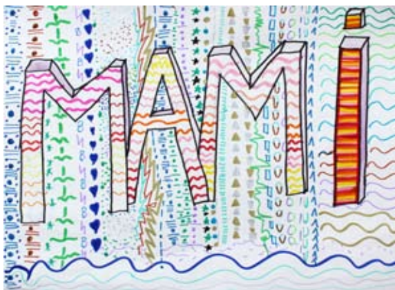
Lucija Sivec, 5. a