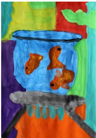
Paskal Rojko, 3. a