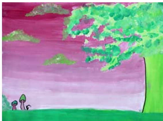
Nika Homec, 6. a

igrišče uničeno. Bili so zelo žalostni in začeli so jokati. Ko so njihove solze padle na igrišče, se je ponovno zgodila čarovinja. Igrišče je bilo spet celo in žoge so se vrnile.