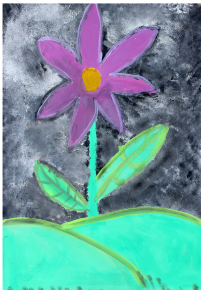
Lucija Sivec, 5. a