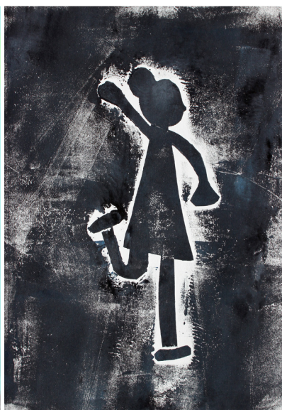
Tia Toplak, 3. a