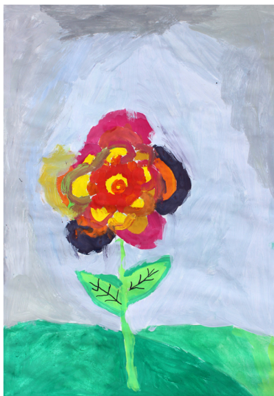
Maša Vogrin, 5. a