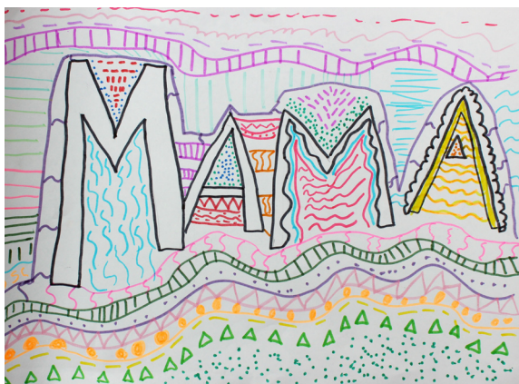
Zoja Mlinarič, 5. a