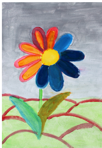
Eva Ornik, 5. a