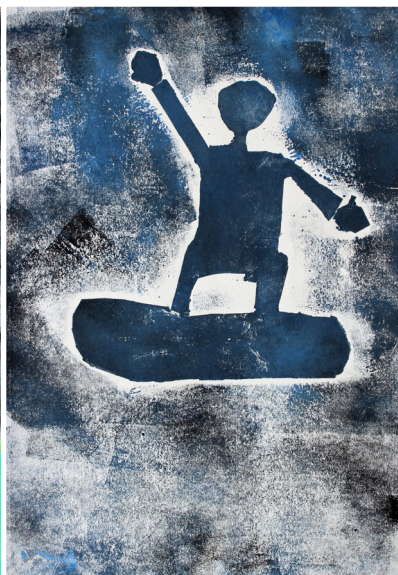
Vito Balaj, 3. a