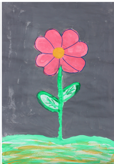
Teo Fekonja, 5. a