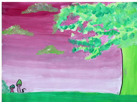
Nika Homec, 6. a

igrišče uničeno. Bili so zelo žalostni in začeli so jokati. Ko so njihove solze padle na igrišče, se je ponovno zgodila čarovnija. Igrišče je bilo spet celo in žoge so se vrnile.