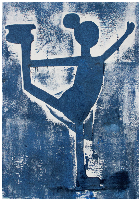
Klara Sužnik, 3. a