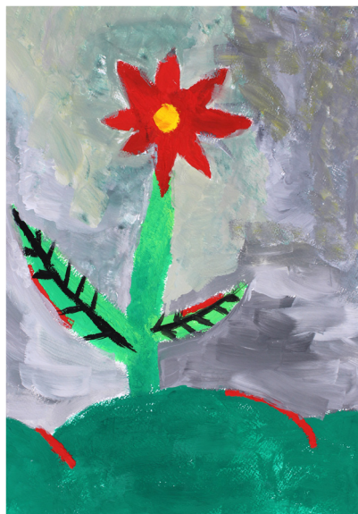
Matic Kunštič, 5. a