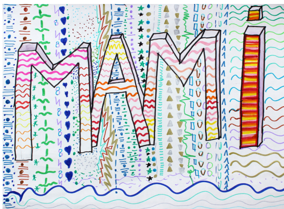
Lucija Sivec, 5. a