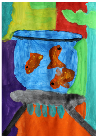
Paskal Rojko, 3. a