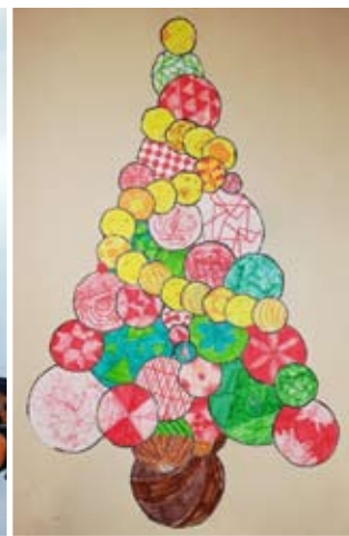
Neja Ornik, 7. b