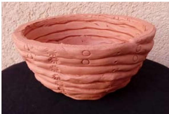
Neja Ornik, 7. b