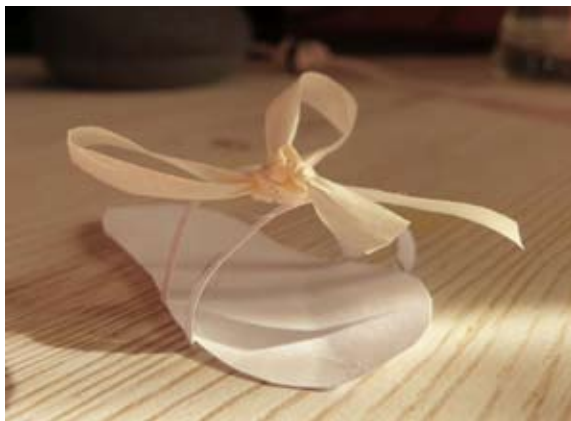
Mellanie Trinkaus, 7. a