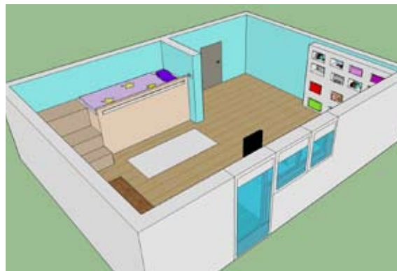
Špela Gavez, 8. a