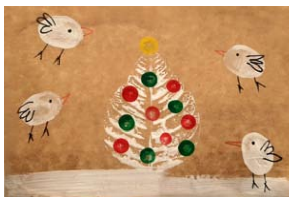
Lukas Rojko, 5. a