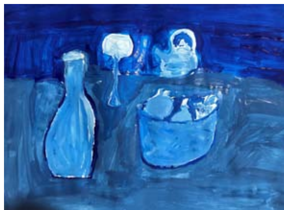
Matic Družovič, 8. a