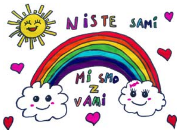
Lina Sekol, 5. a