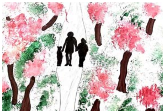
Teo Fekonja, 5. a