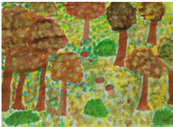
Gal Šilec Vogrin, 5. a