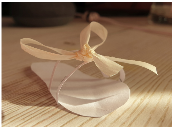
Mellanie Trinkaus, 7. a