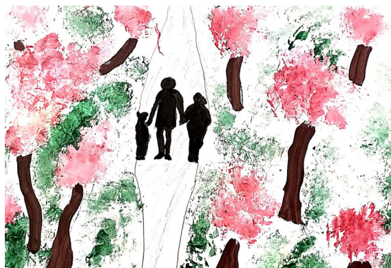
Teo Fekonja, 5. a