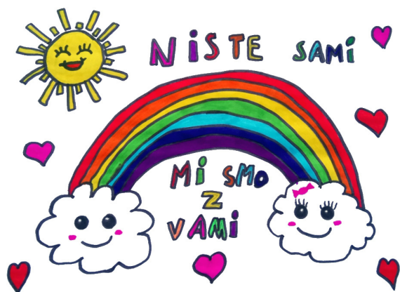
Lina Sekol, 5. a