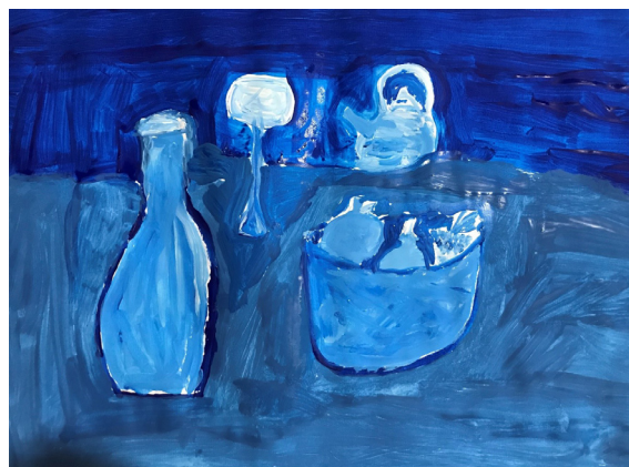
Matic Družovič, 8. a