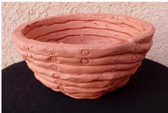
Neja Ornik, 7. b