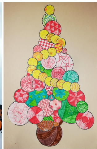
Neja Ornik, 7. b