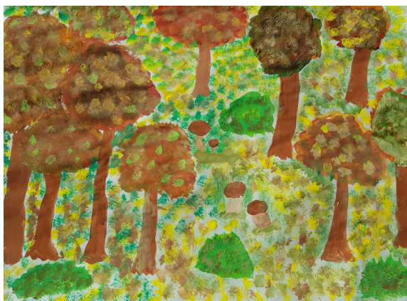
Gal Šilec Vogrin, 5. a