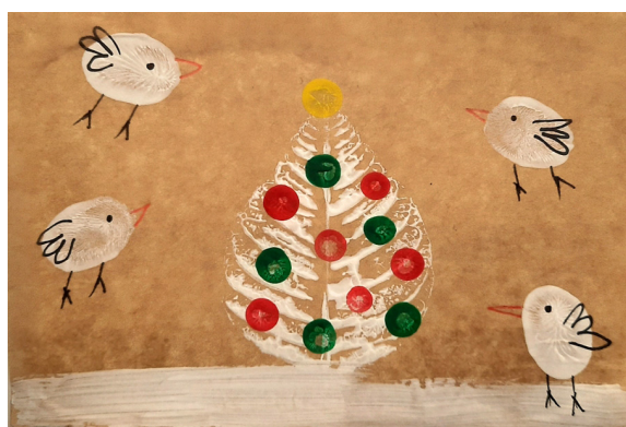
Lukas Rojko, 5. a