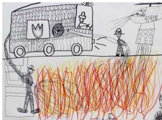
Zoja Potočnik, 3. a

je vprašala, kaj se mu je zgodilo. Povedal ji je, da se je izgubil. Žaba je medvedka odpeljala domov. Ko sta prispela, sta se medvedek in njegova mama objela.