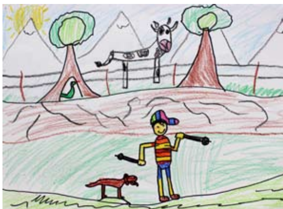
Nejc Klemenšak, 2. a