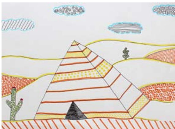
Neža Štruc, 7. a