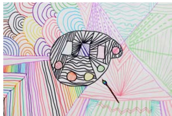
Neja Ditner, 6. b