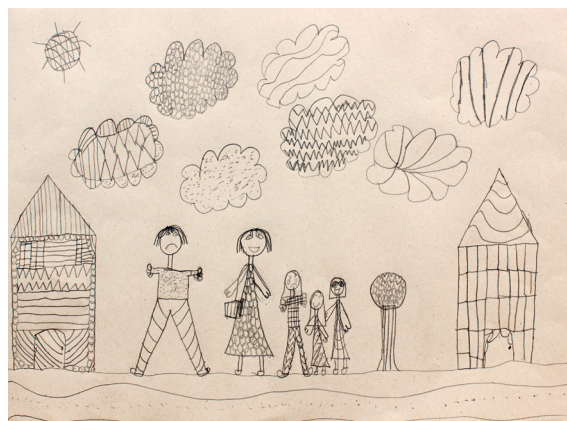
Vita Vogrin, 3. a