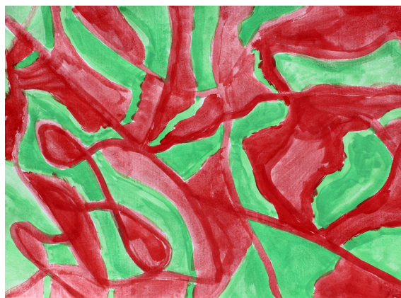
Amadej Ploj, 8. a