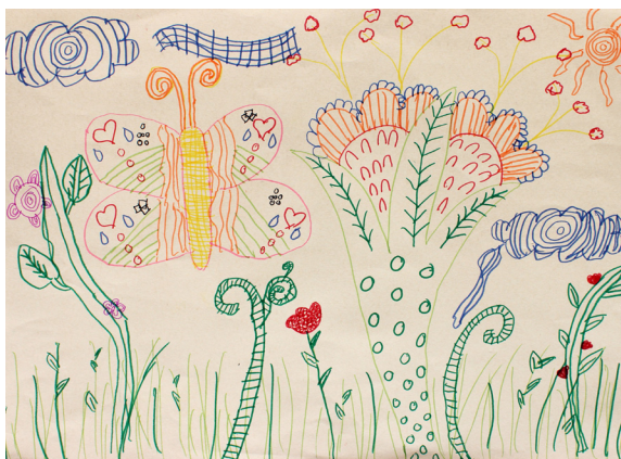
Maša Vogrin, 5. a