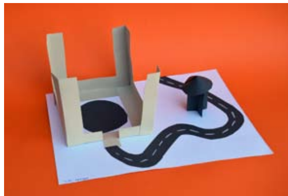
Timotej Kocbek, 5. b