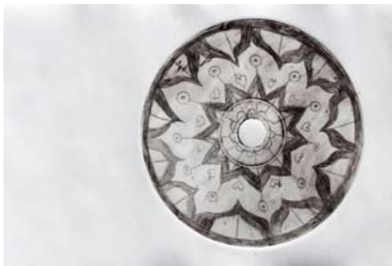
Ema Kovač, 8. b