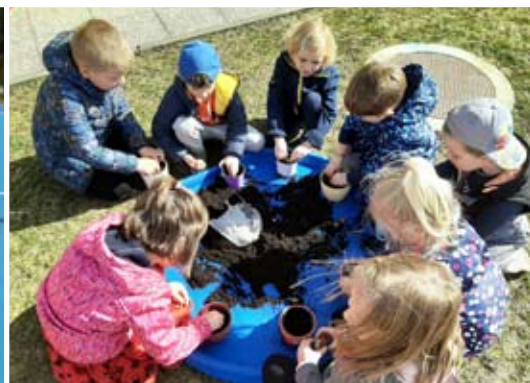
Otroci skupine Sončki z vzgojiteljicama