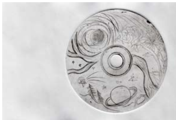
Gaja Homec, 8. b