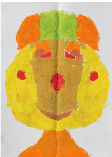
Filip Kurnik, 4. a