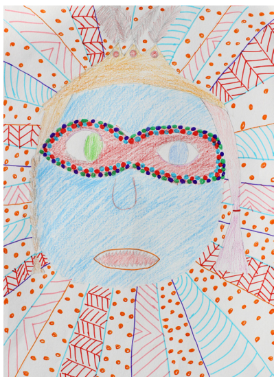
Eva Ornik, 4. a