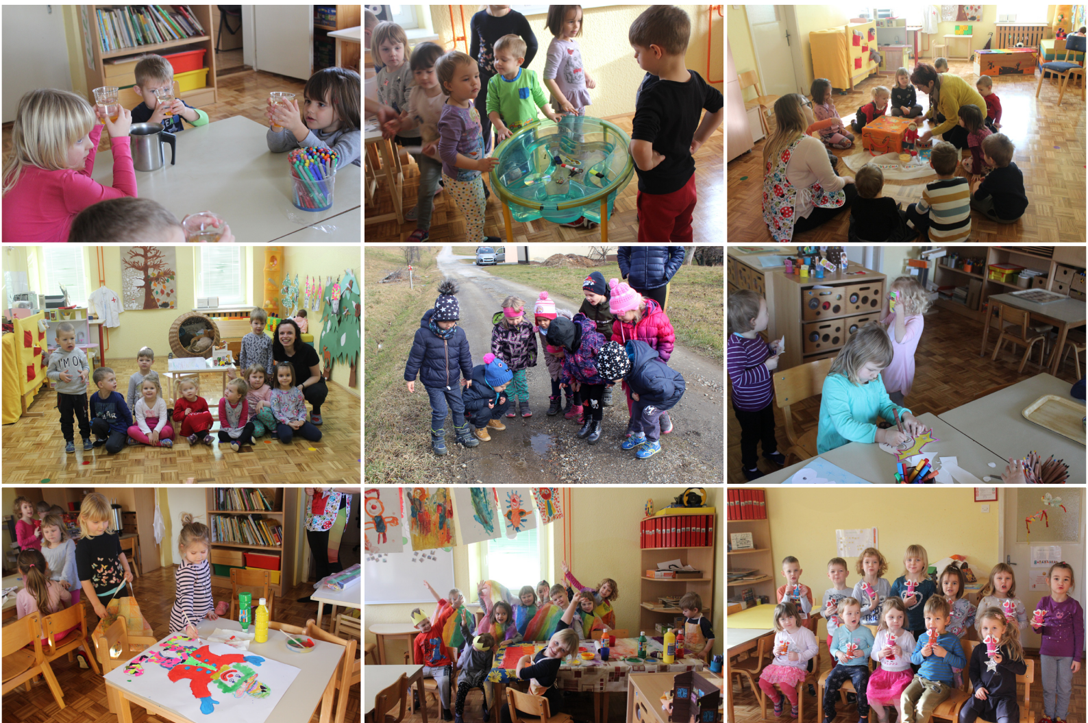
Otroci skupine Mavrice z vzgojiteljicami