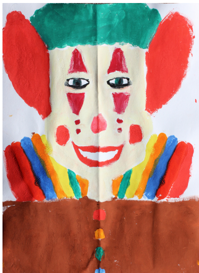
Lucija Sivec, 4. a