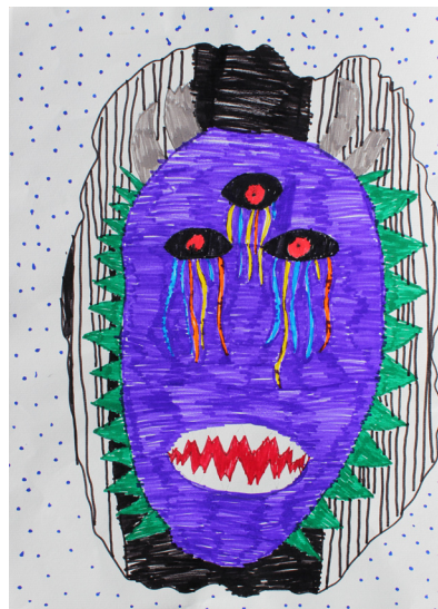
Matic Kunštič, 4. a