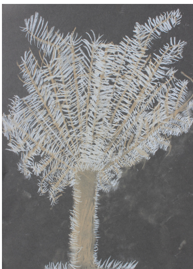
Tilen Malek, 2. a