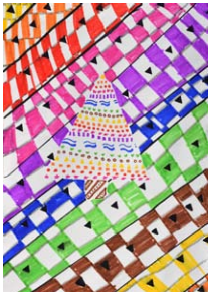
Neja Ditner, 5. b