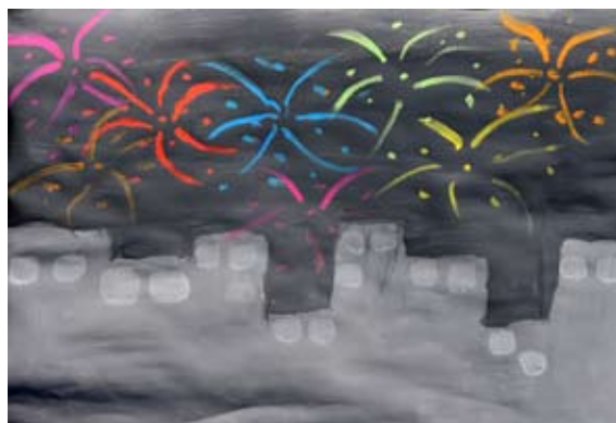
Neža Kuhar, 5. b