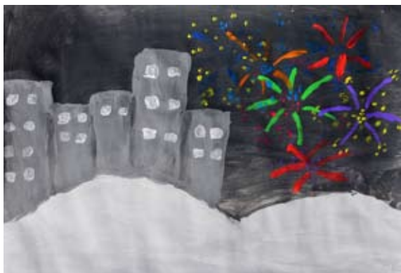
Neja Ditner, 5. b