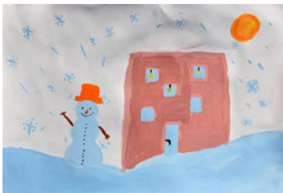
Zala Družovič, 5. a