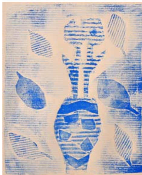
Anže Majer, 5. b

hitro na teveju se vrti, da je vsak ne zamudi. Ko pa reklame več ni, na kavču nihče več ne sedi.