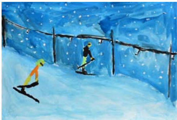
Mitja Zorec, 5. a