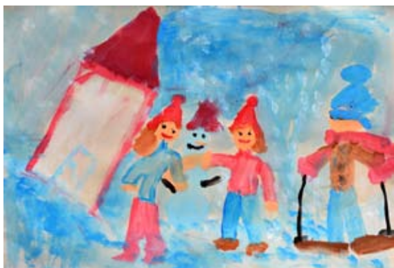
Nika Farazin, 5. a