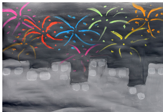
Neža Kuhar, 5. b