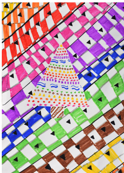
Neja Ditner, 5. b