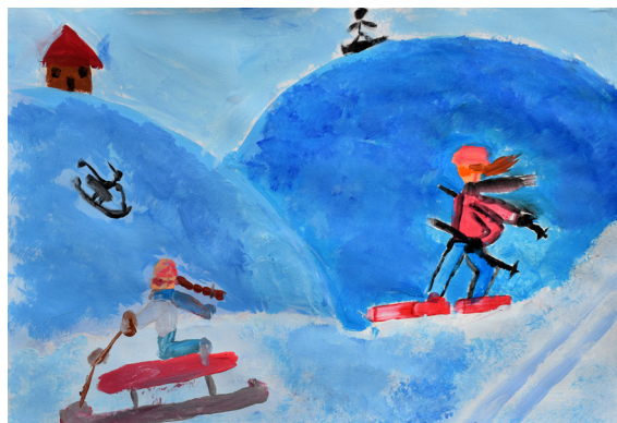
Lia Lucia Kmetič, 5. a