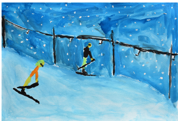
Mitja Zorec, 5. a