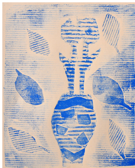
Anže Majer, 5. b

hitro na teveju se vrti, da je vsak ne zamudi. Ko pa reklame več ni, na kavču nihče več ne sedi.