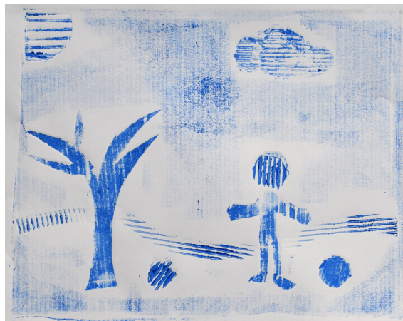
Timotej Kocbek, 5. b