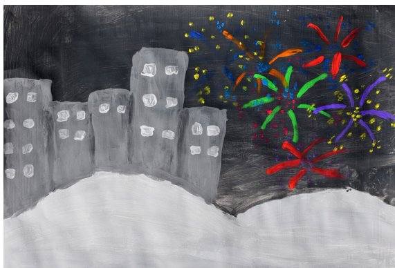
Neja Ditner, 5. b