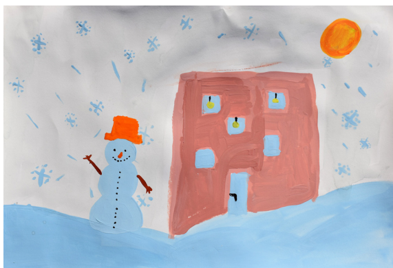
Zala Družovič, 5. a