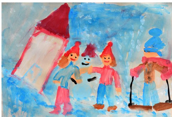
Nika Farazin, 5. a