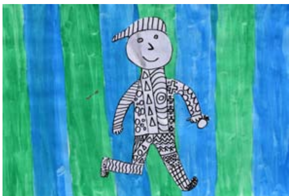
Gal Šilec Vogrin, 4. a