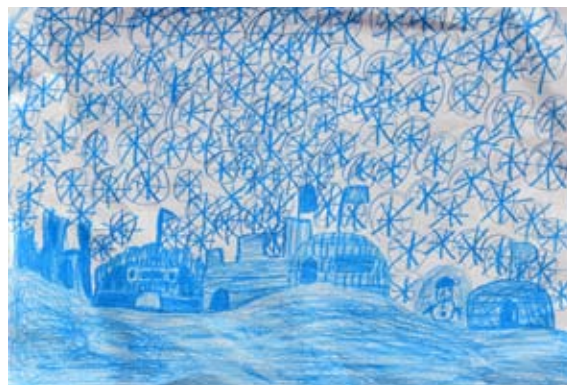
Nejc Ozmeč, 5. b