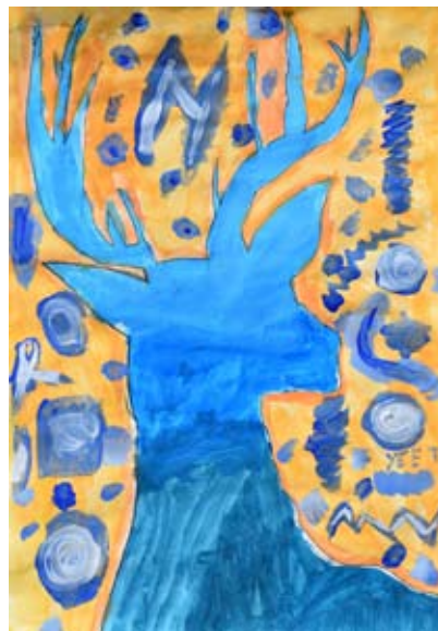
Rok Mišič, 8. b