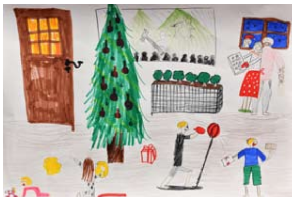
Lia Lucia Kmetič, 5. a