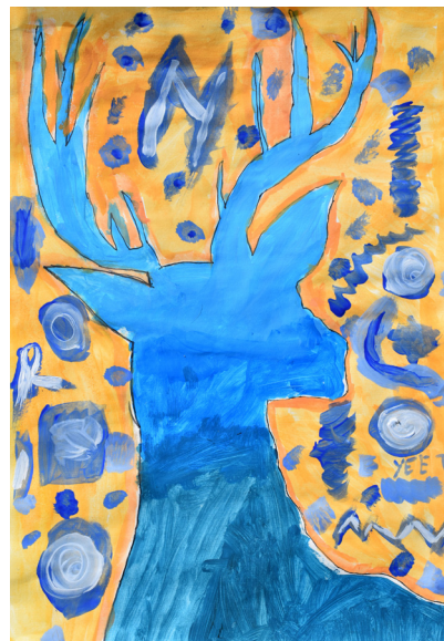
Rok Mišič, 8. b