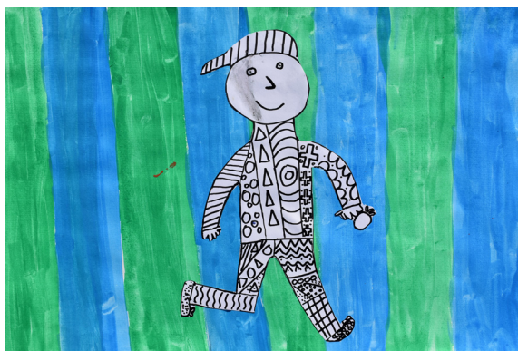
Gal Šilec Vogrin, 4. a