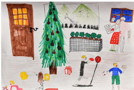
Lia Lucia Kmetič, 5. a