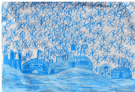
Nejc Ozmeč, 5. b